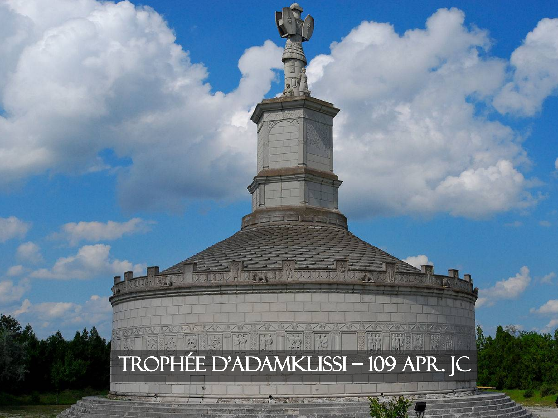
TROPHÉE D'ADAMKLISSI – 109 APR. JC