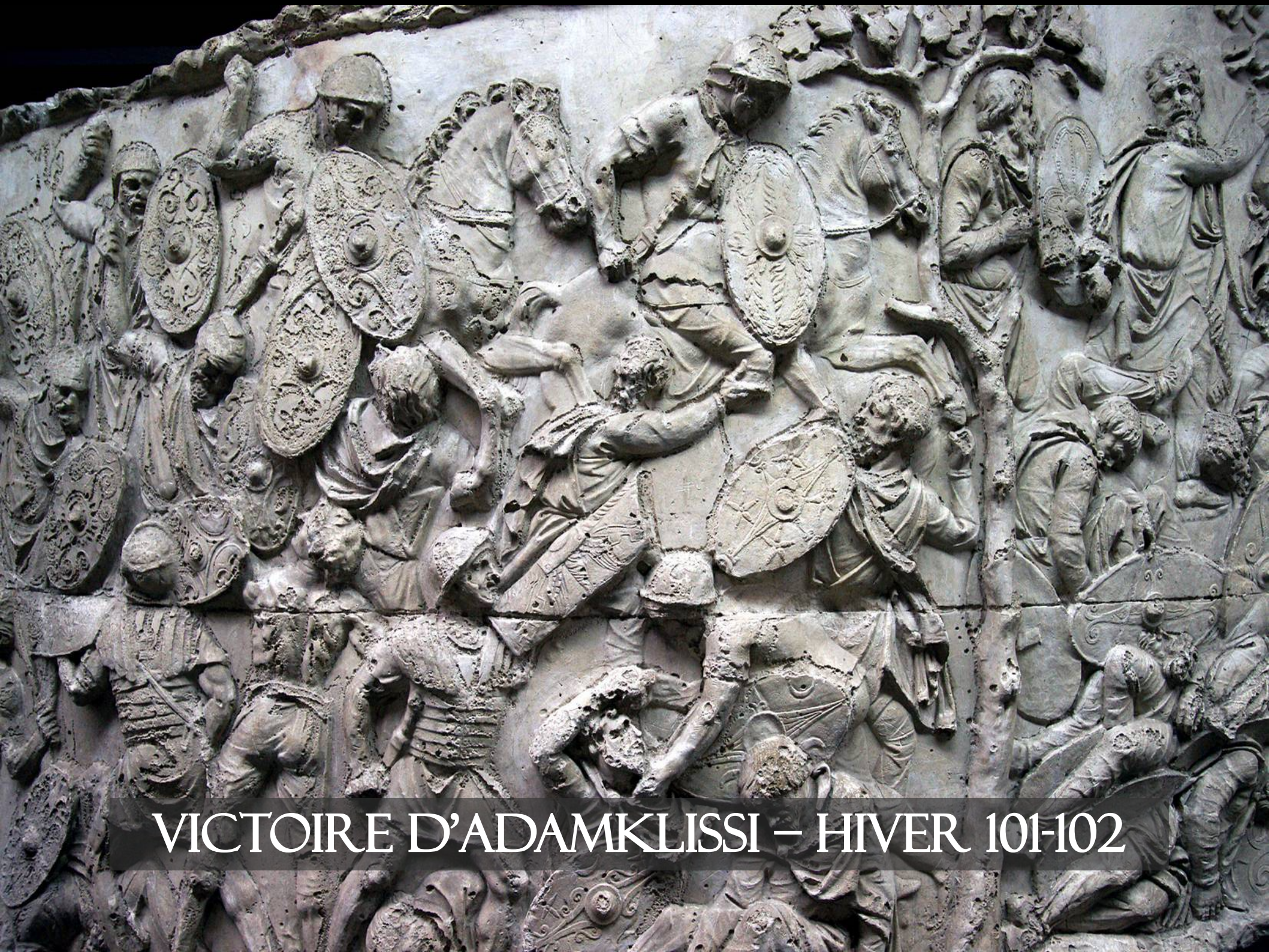
VICTOIRE D'ADAMKLISSI – HIVER 101-102