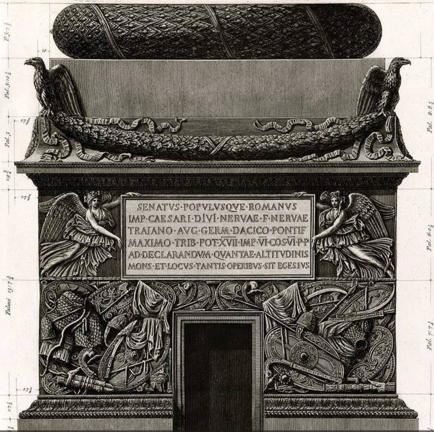
RELEVÉ DE PIRANÈSE EN 1774