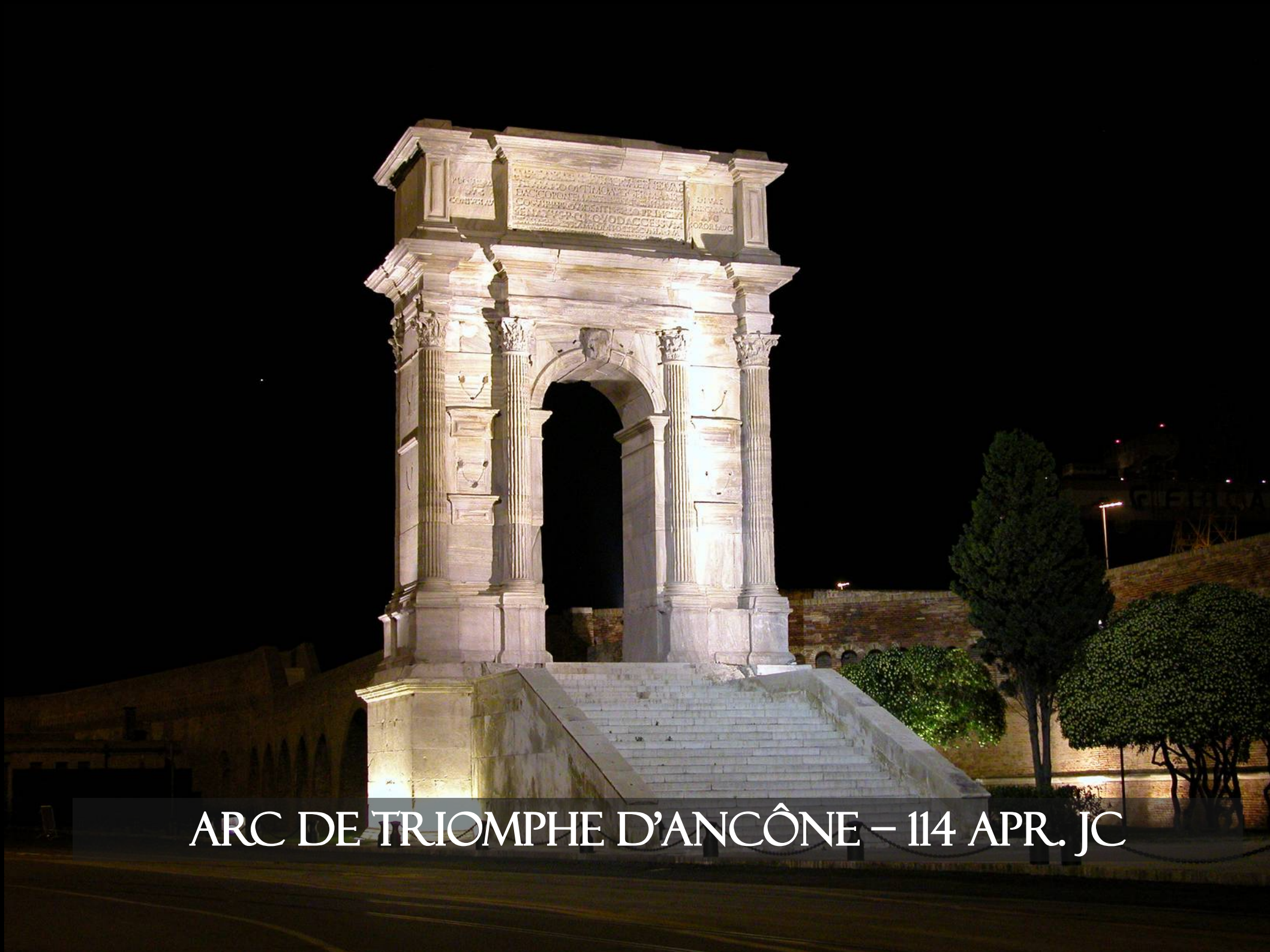
ARC DE TRIOMPHE D'ANCÔNE – 114 APR. JC