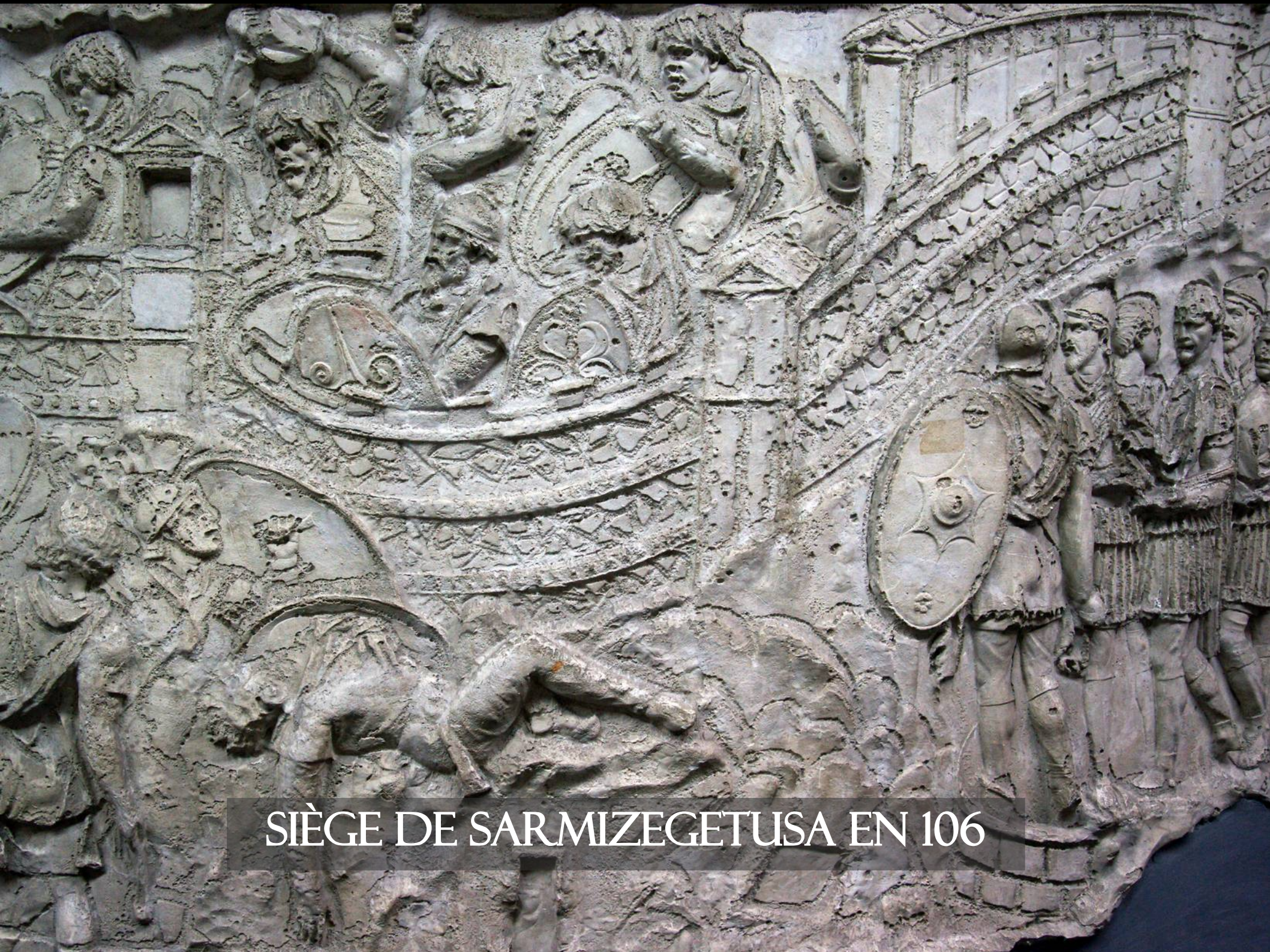
SIÈGE DE SARMIZEGETUSA EN 106