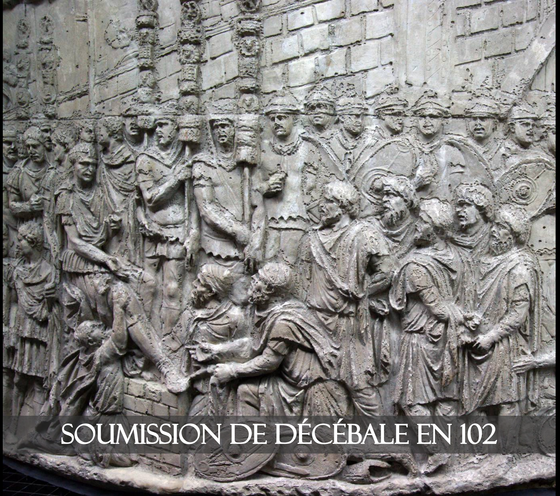
SOUMISSION DE DÉCÉBALE EN 102