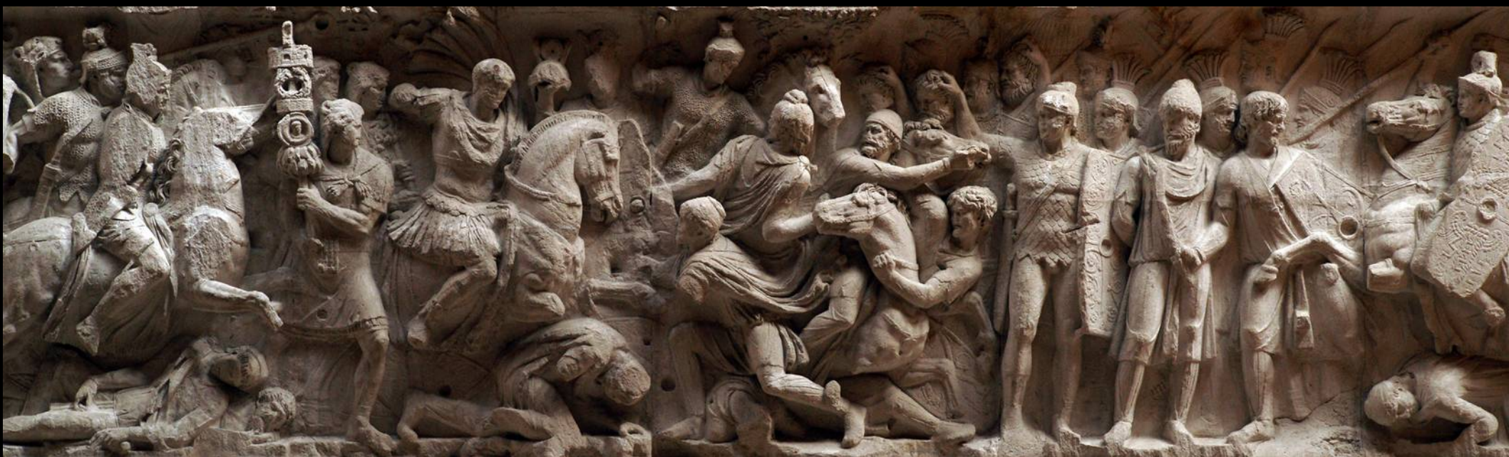
GRANDE FRISE CÉLÉBRANT LES EXPLOITS DE TRAJAN (RÉEMPLOYÉE SUR L'ARC DE CONSTANTIN)