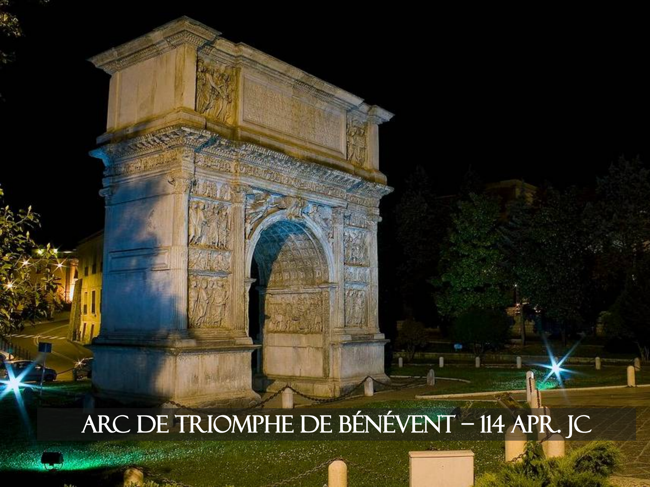
ARC DE TRIOMPHE DE BÉNÉVENT – 114 APR. JC