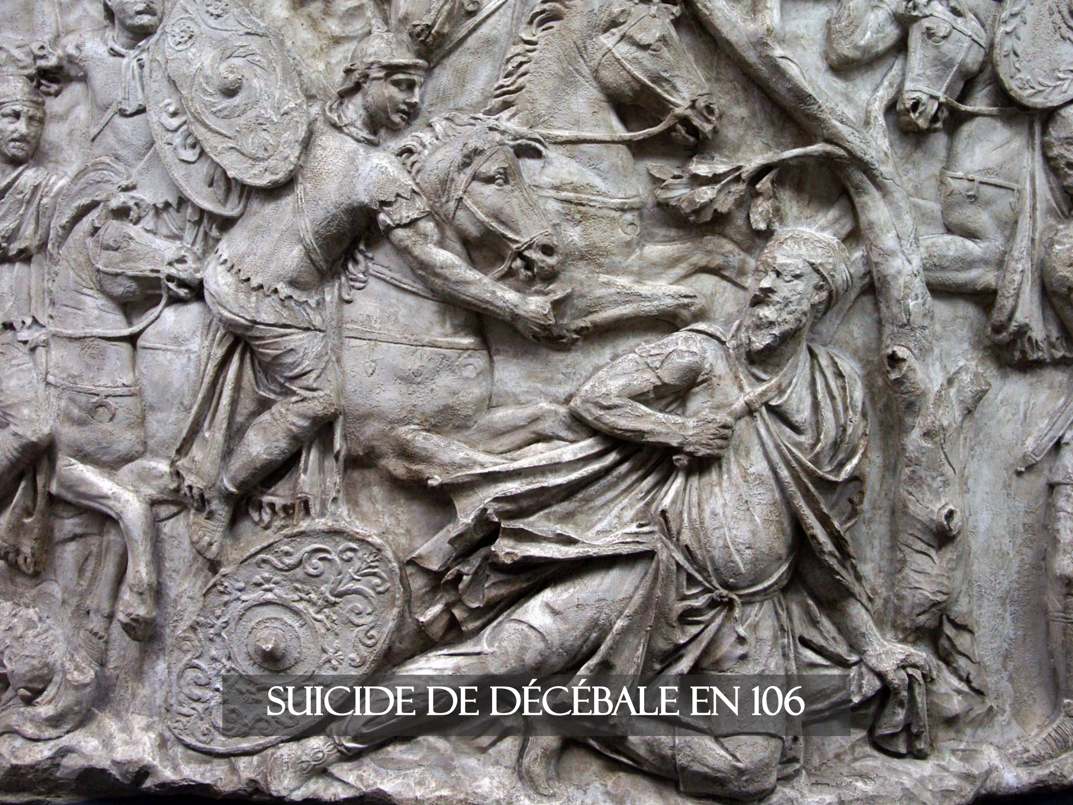
SUICIDE DE DÉCÉBALE EN 106