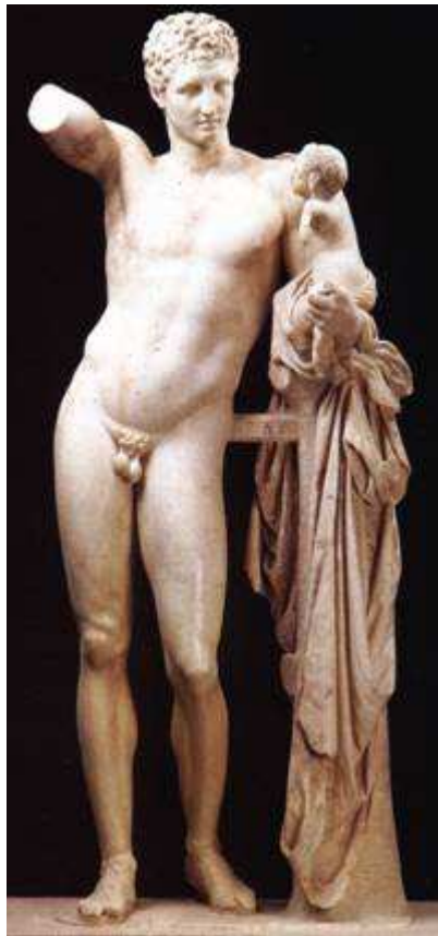
Hermès de Praxitèle

C'est après la conquête de la Grèce par Rome que naît l'art romain proprement dit, vers 100 avant J.C. Il est donc influencé par l'art grec ainsi que par l'art étrusque (arc et voûte) qui lui-même est influencé de l'art grec. Ces deux héritages ont profondément marqué l'art romain ; cependant celui-ci est pleinement original car il a su transformer les influences subies . Il a commencé par copier des œuvres grecques. Les riches Romains collectionnent les originaux grecs ou en font réaliser des copies. Souvent, l'original étant perdu, nous ne connaissons les œuvres des grands sculpteurs grecs (Phidias, Praxitèle, Polyclète etc...) que par leurs copies romaines.