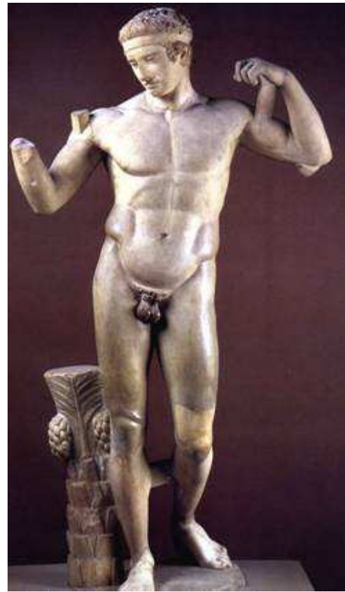
Diadoudème de Polyclète

Par la suite, les Romains ne se contentent plus de cette imitation : l'hellénisme, en matière d'art, c'est la façon originale dont ils ont su utiliser puis dépasser les courants artistiques qui les ont précédés. L'art grec vise le beau pour lui-même et l'harmonie ; c'est un art destiné non aux hommes mais aux dieux, désintéressé. L'art romain constitue une marque de possession (dans les colonies, il marque le territoire de l'empreinte du pouvoir romain) ; il recherche l'utile et le colossal, la force et la durée. Il s'intéresse au confort ; l'architecture n'est pas seulement religieuse mais aussi civile, monumentale : théâtres, thermes, amphithéâtres, aqueducs, marchés etc... C'est un art destiné aux hommes, qui met en scène le pouvoir et orchestre