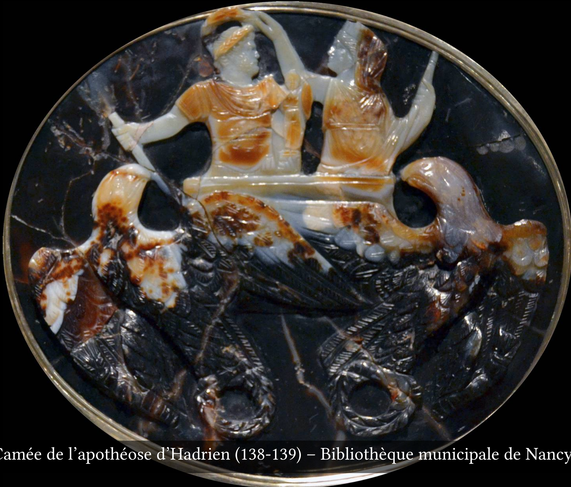
Camée de l'apothéose d'Hadrien (138-139) – Bibliothèque municipale de Nancy