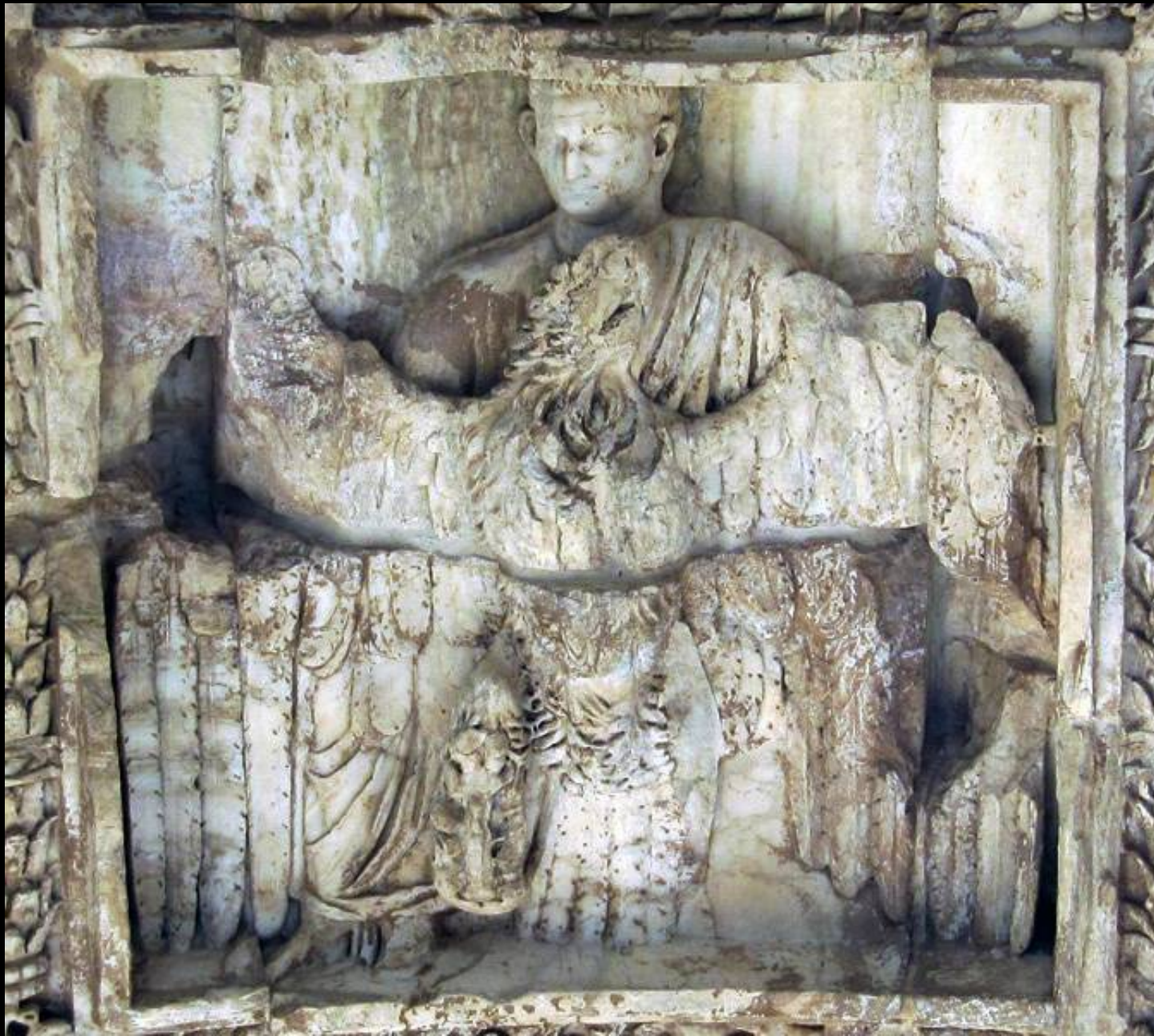
Plafond de l'arche de l'arc de triomphe de Titus (après 81 apr. JC) - Rome