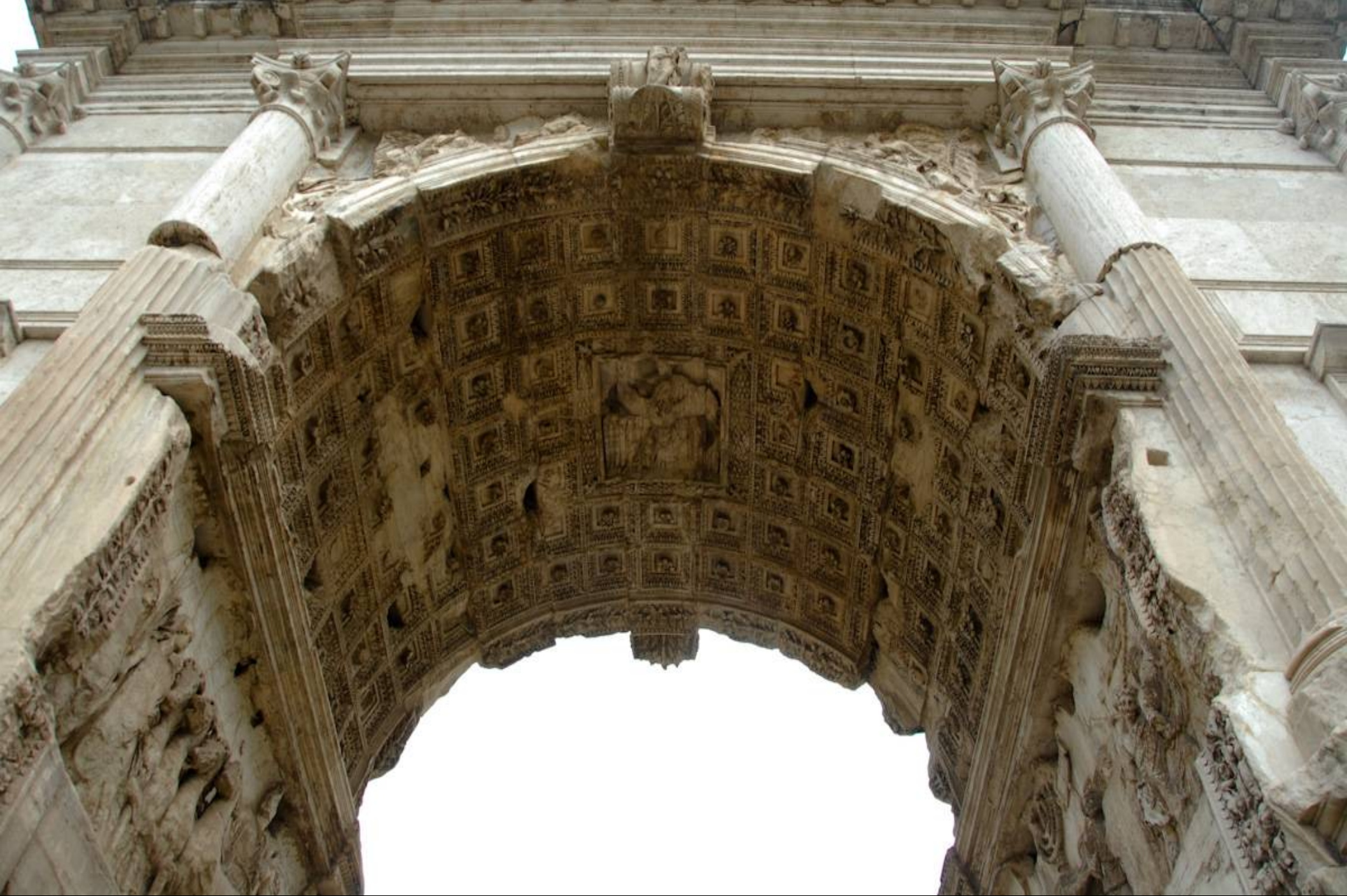
Plafond de l'arche de l'arc de triomphe de Titus (après 81 apr. JC) - Rome