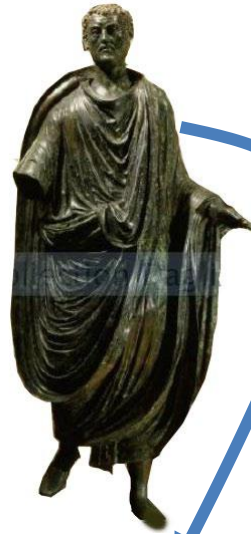
Magistrat gaulois portant la toge

Elites provinciales (Anciens magistrats des cités de droit Latin)