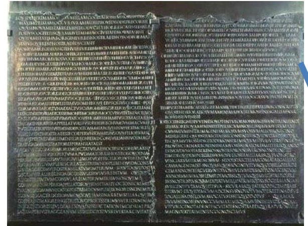
Tables claudiennes de Lyon

Citoyenneté accordée par l'empereur à des personnes ou des groupes