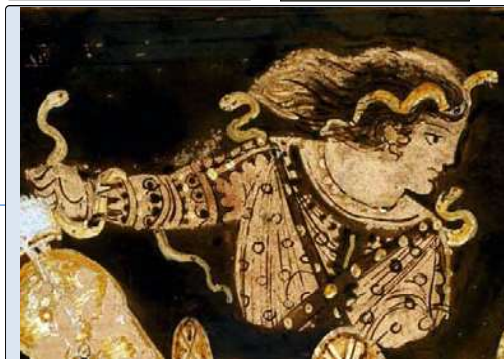
Furiae, arum, f. pl : les Furies, les Erinyes