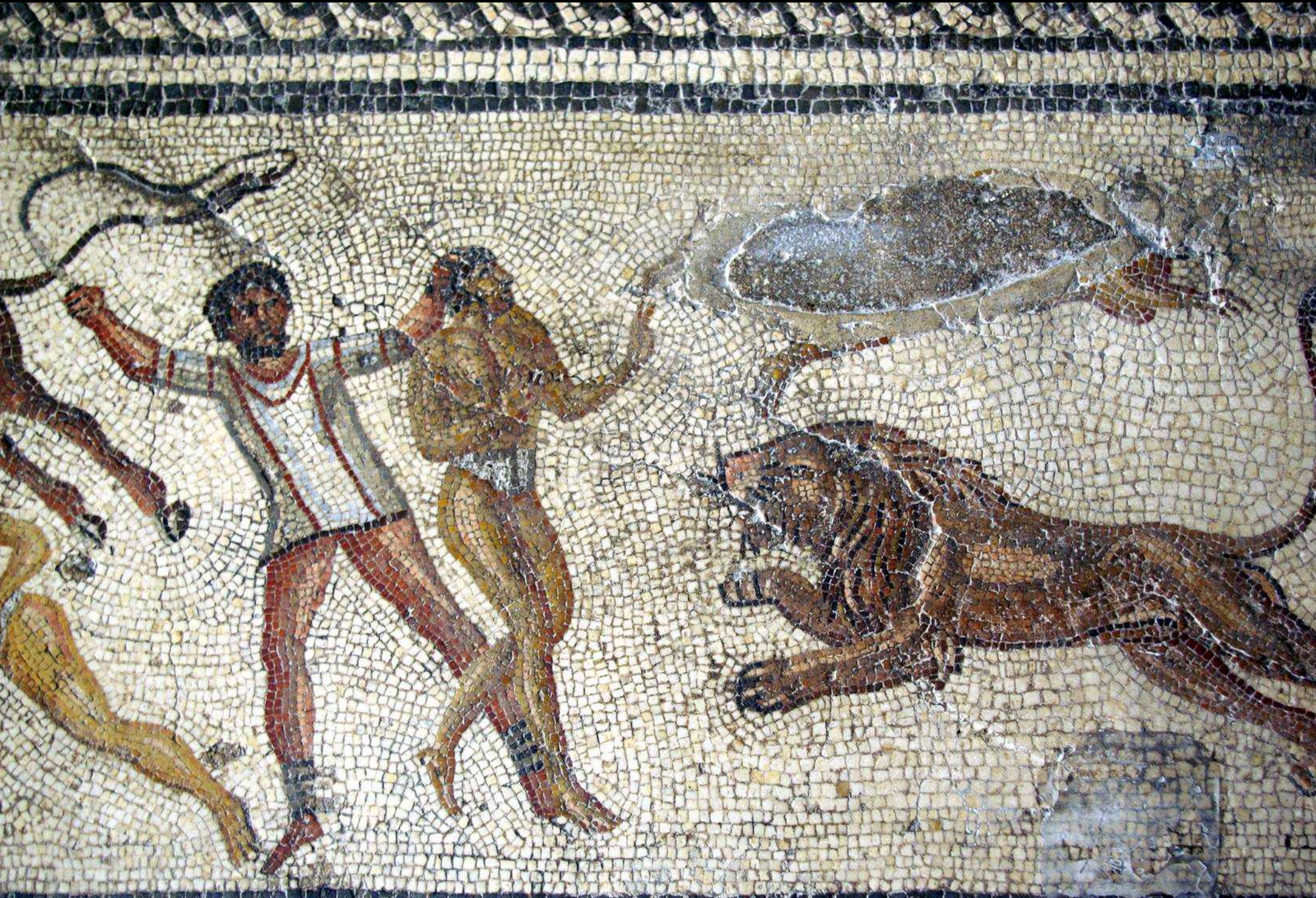
Zliten- IIe s. apr.JC