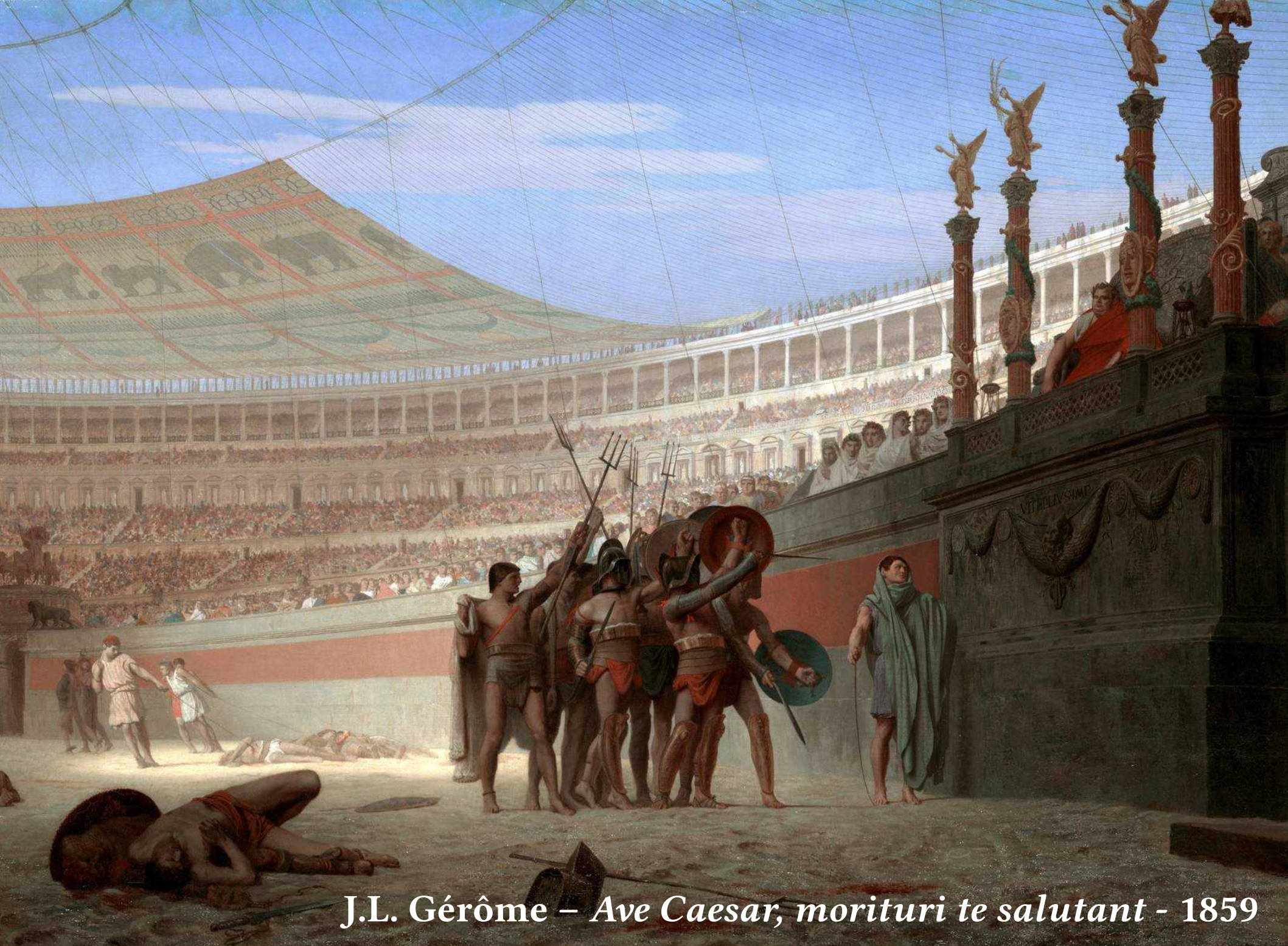
J.L. Gérôme – Ave Caesar, morituri te salutant - 1859