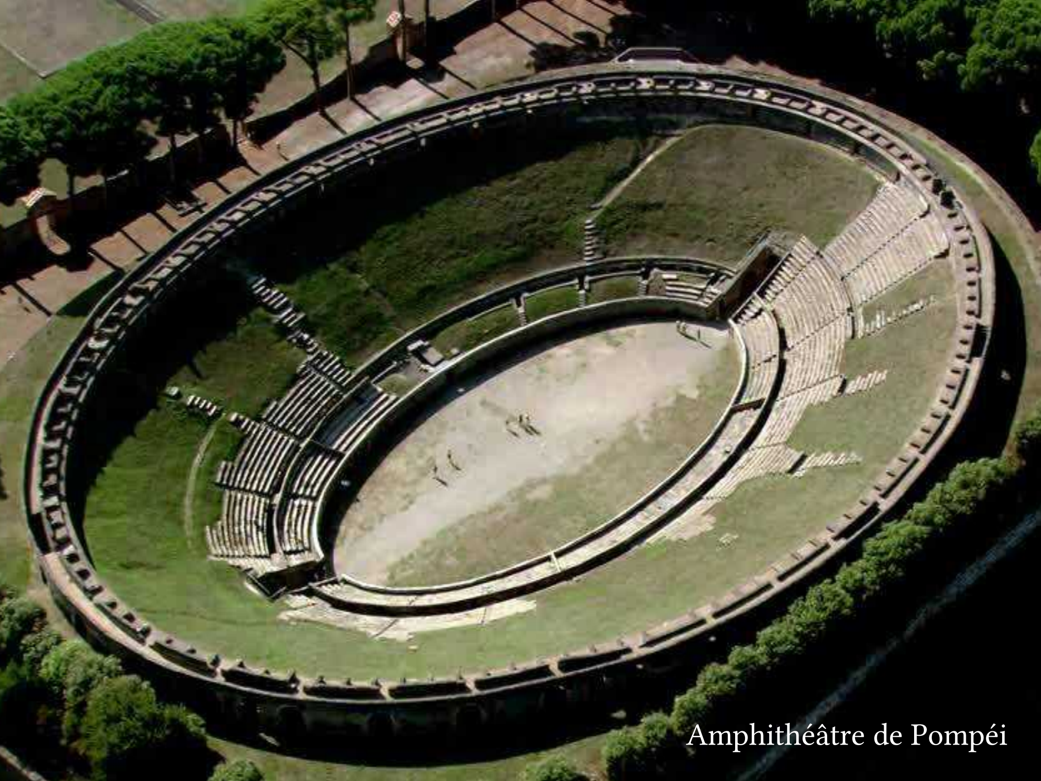
Amphithéâtre de Pompéi