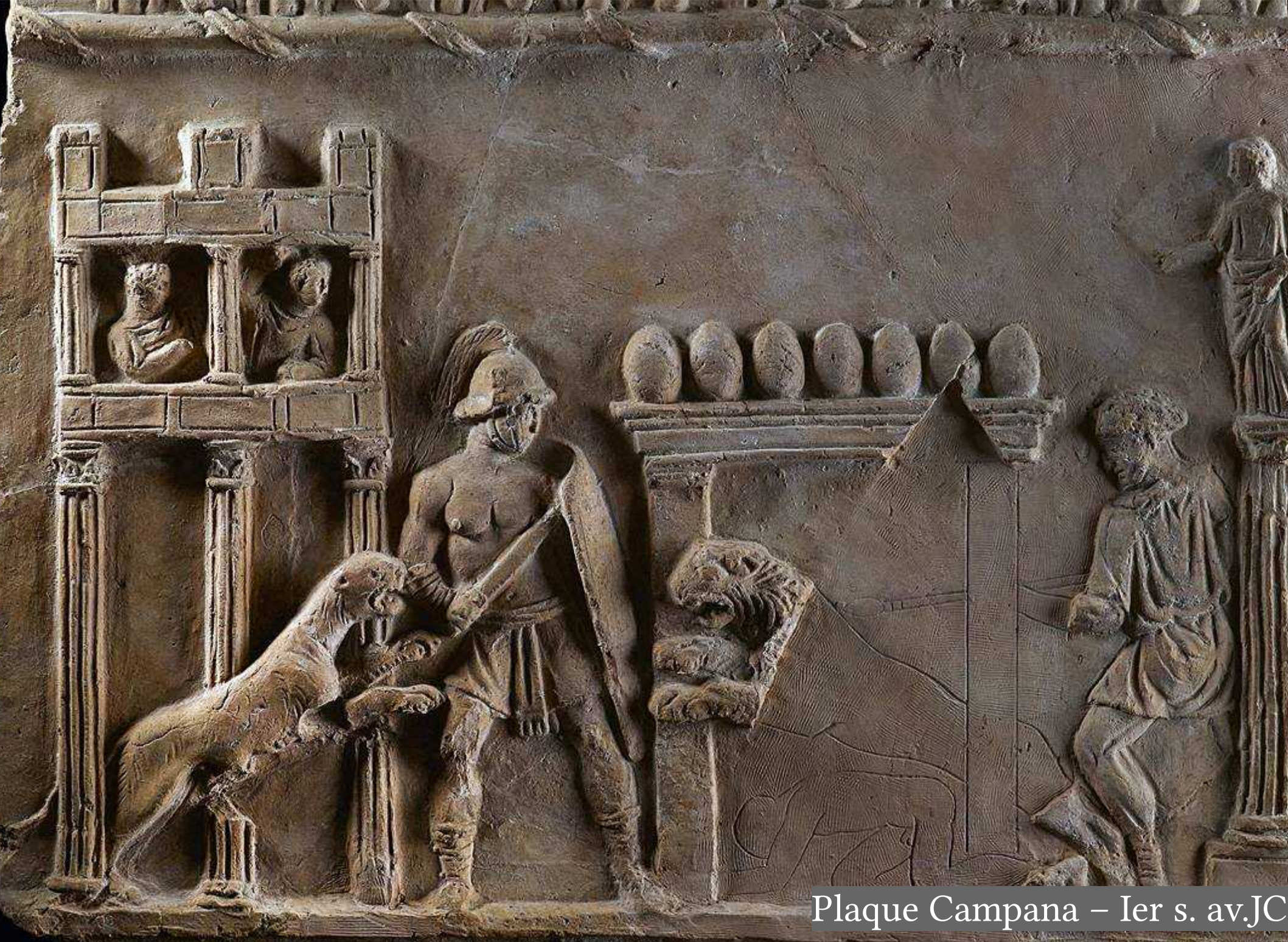
Plaque Campana – Ier s. av.JC