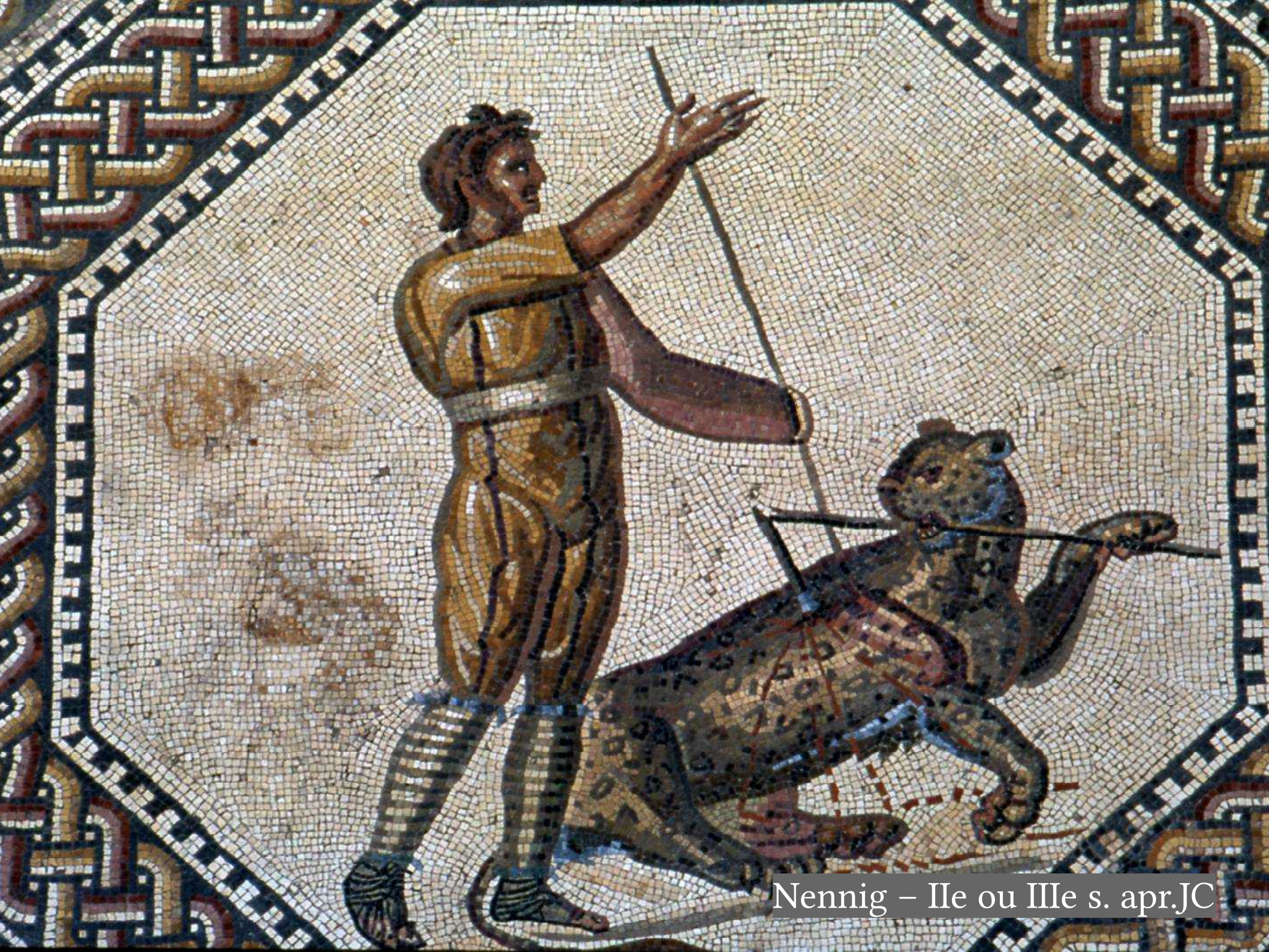
Nennig – IIe ou IIIe s. apr.JC