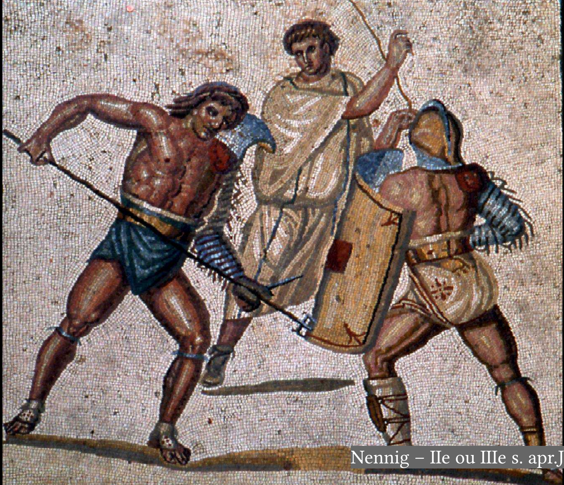
Nennig – IIe ou IIIe s. apr.JC