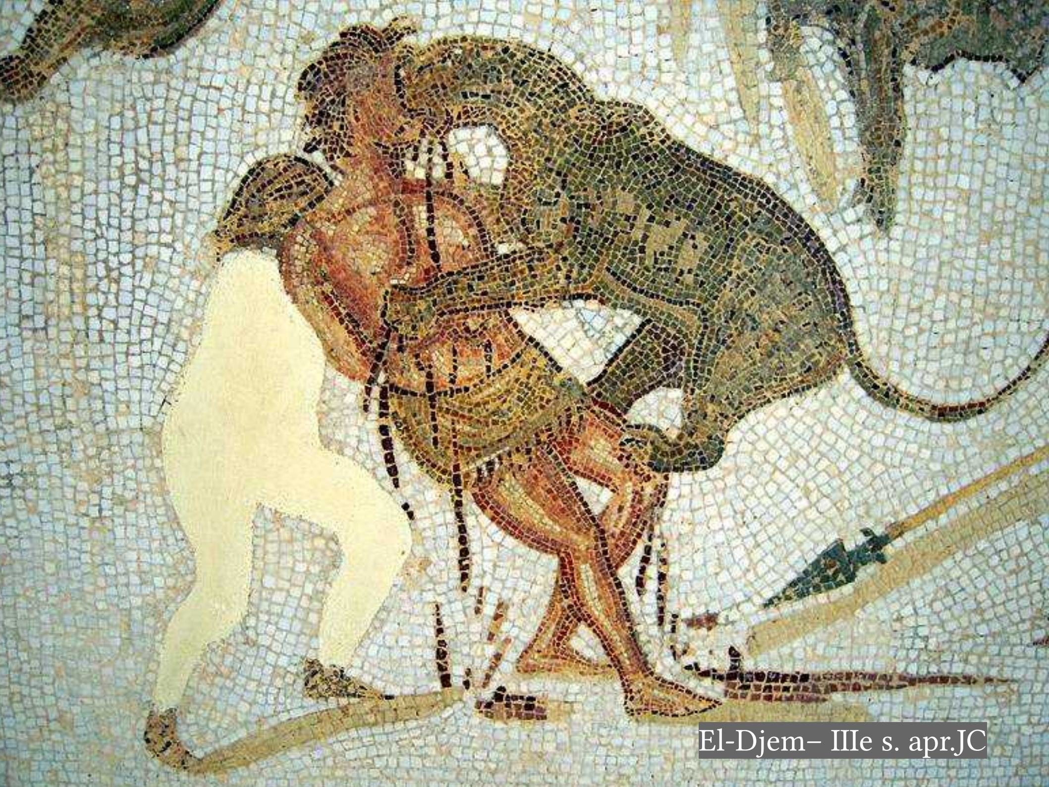
El-Djem- IIIe s. apr.JC