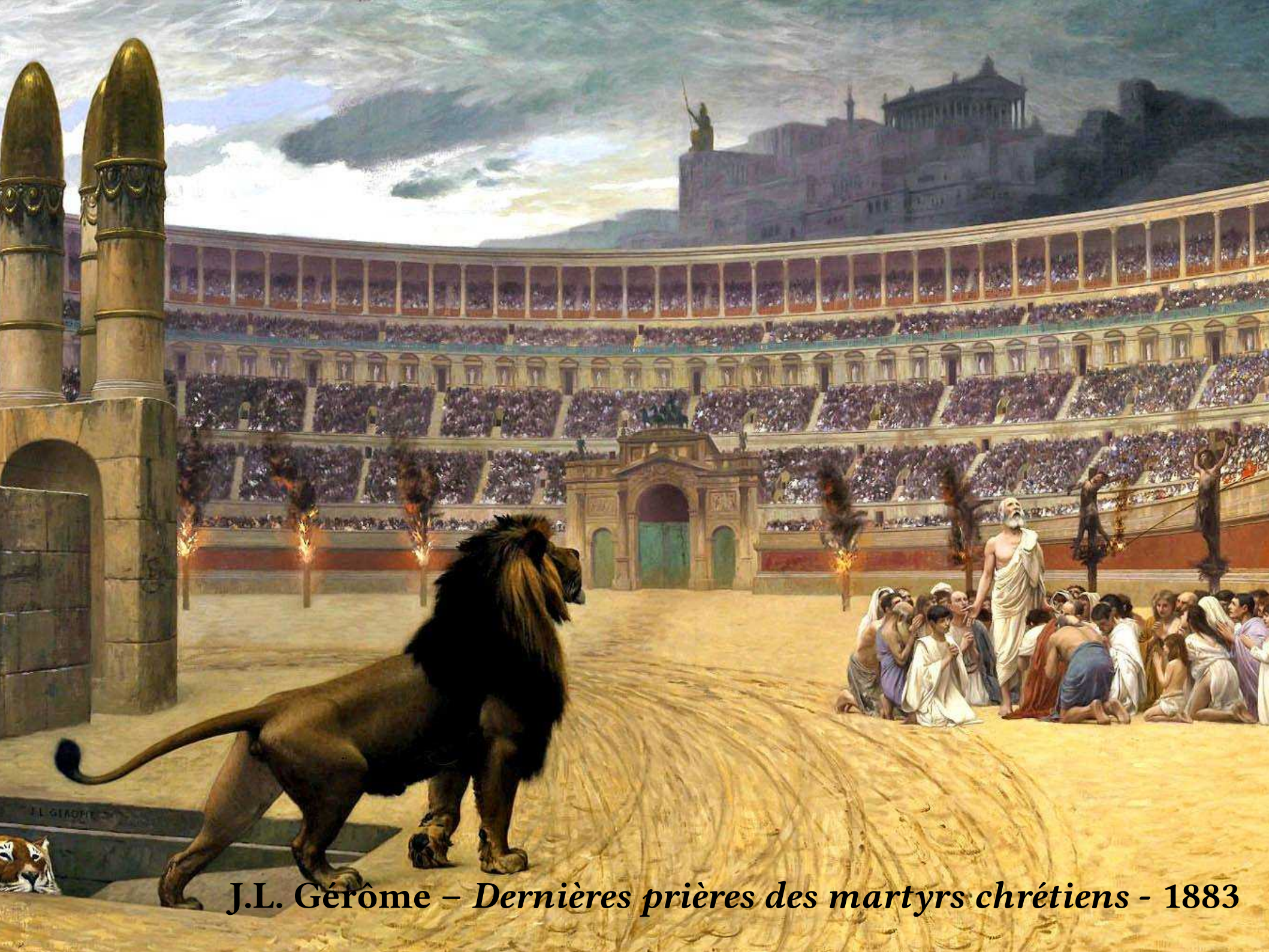
J.L. Gérôme – Dernières prières des martyrs chrétiens - 1883