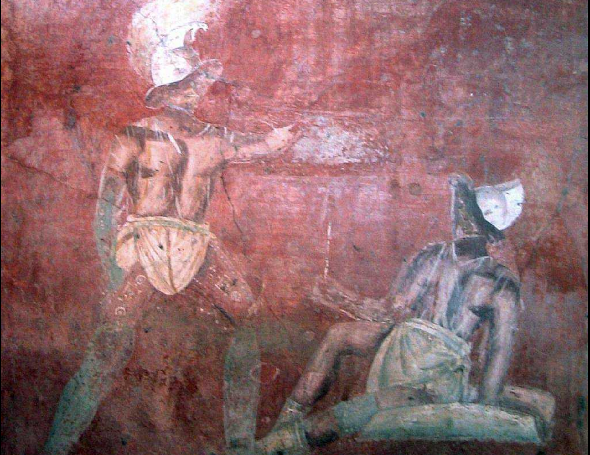
Tombe de Vestorius Priscus – Ier s. apr.JC