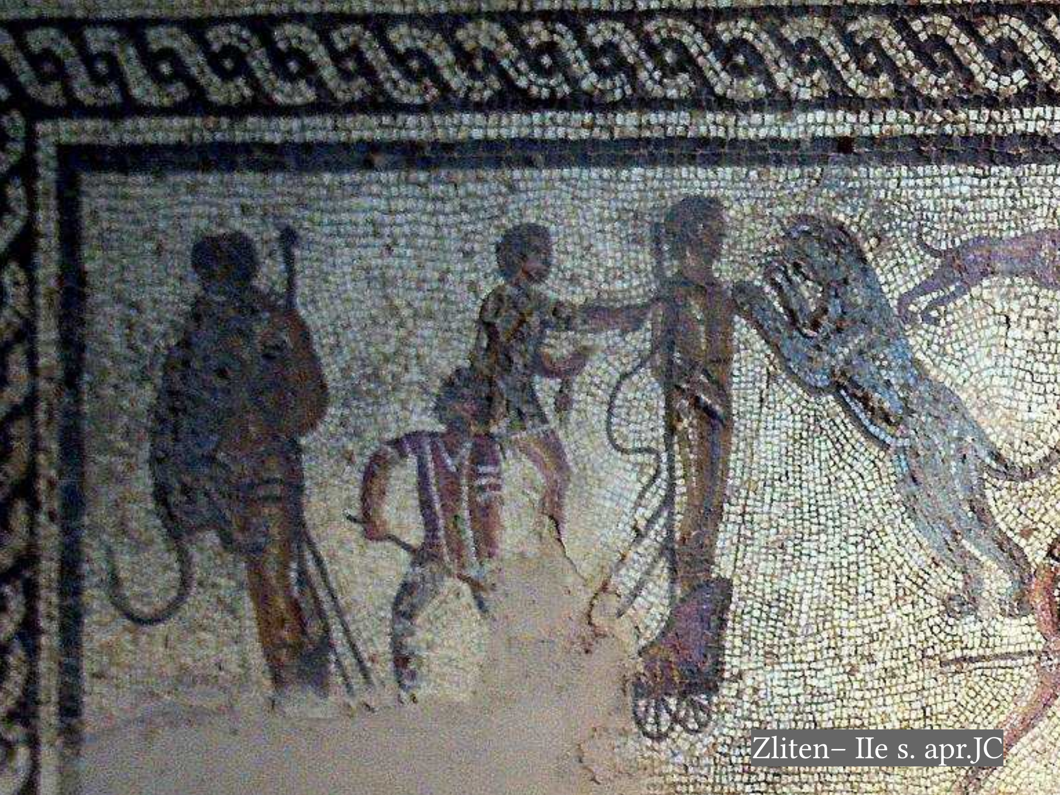
Zliten- IIe s. apr.JC