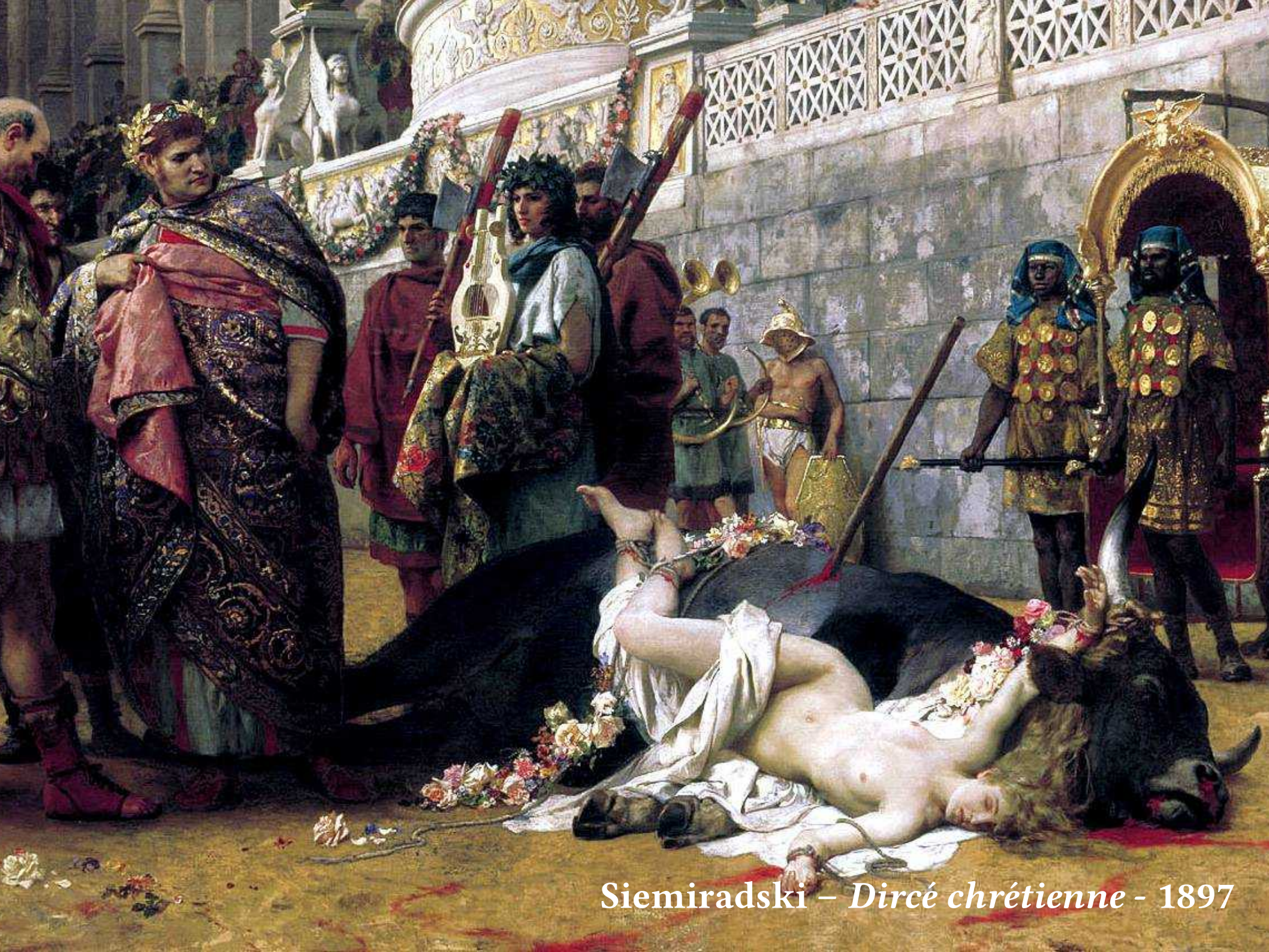
Siemiradski – Dircé chrétienne - 1897