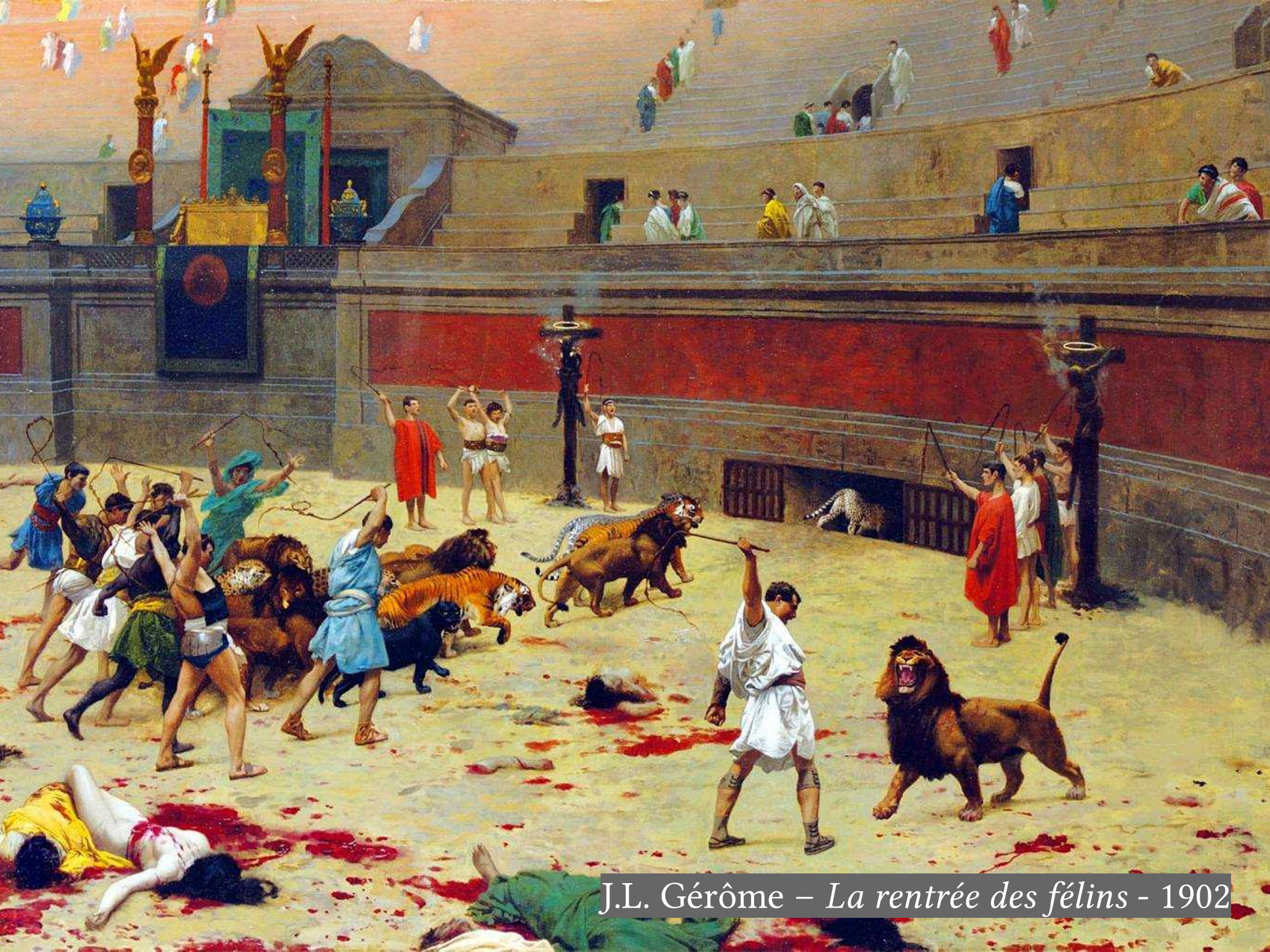
J.L. Gérôme – La rentrée des félins - 1902