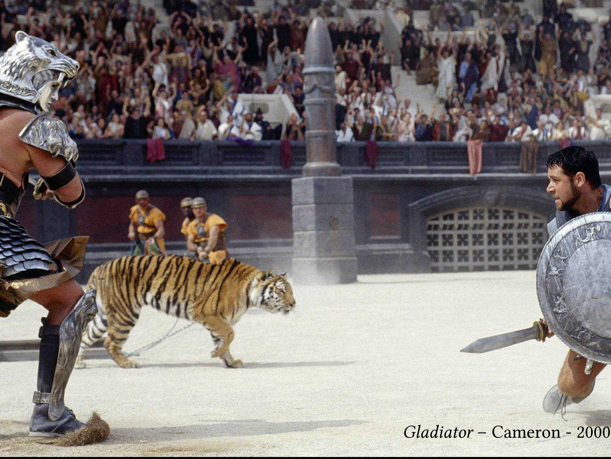
Gladiator – Cameron - 2000