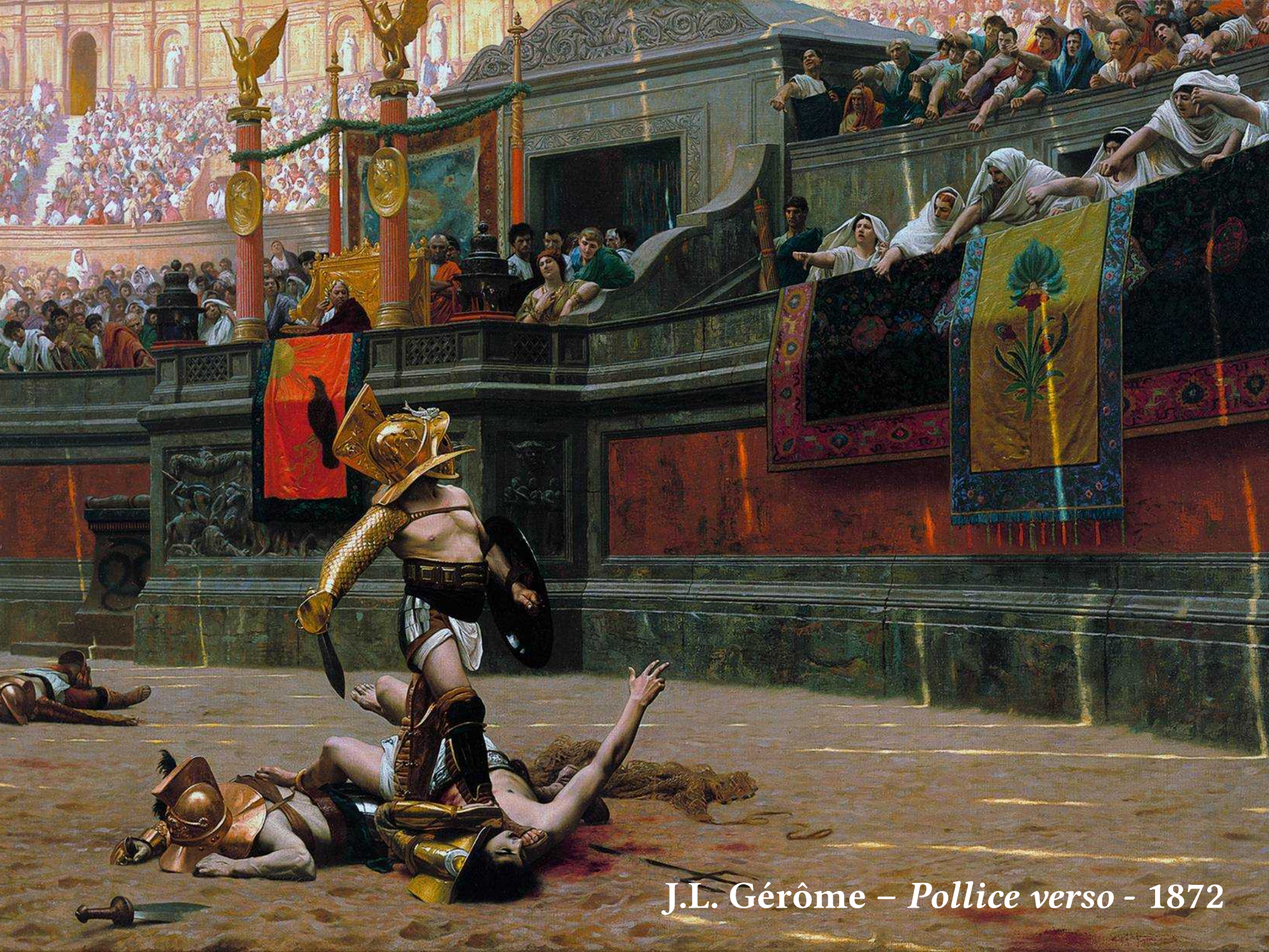
J.L. Gérôme – Pollice verso - 1872