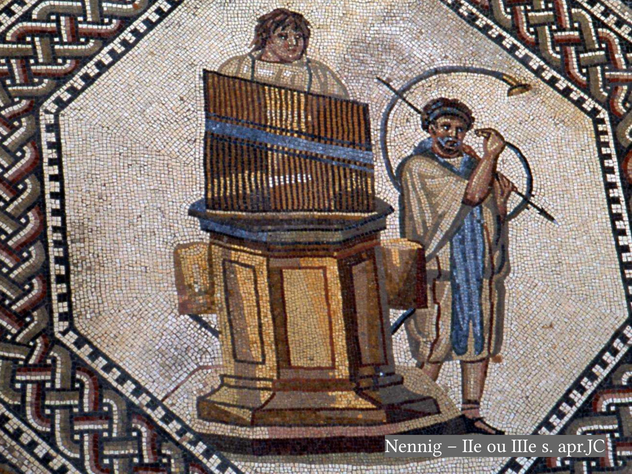
Nennig – IIe ou IIIe s. apr.JC