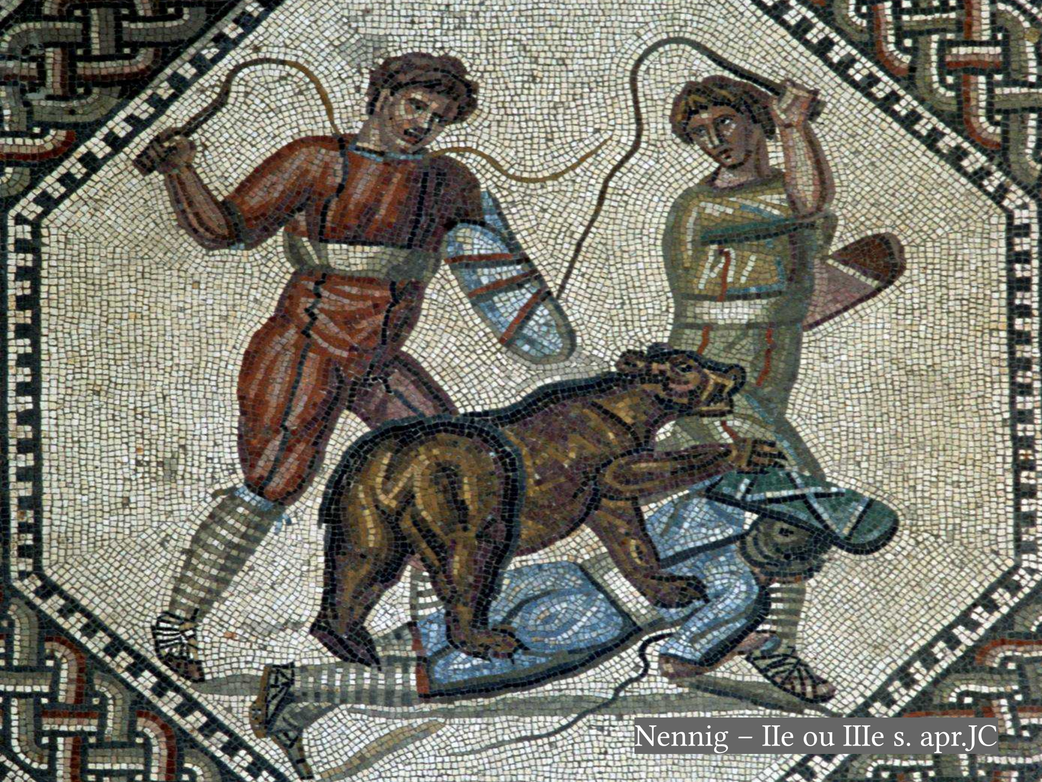
Nennig – IIe ou IIIe s. apr.JC