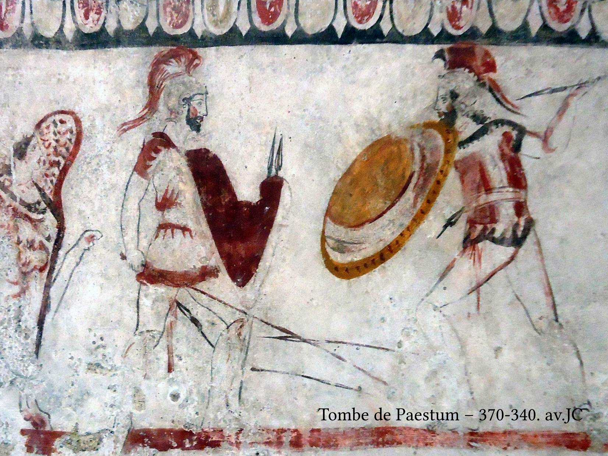
Tombe de Paestum – 370-340. av.JC