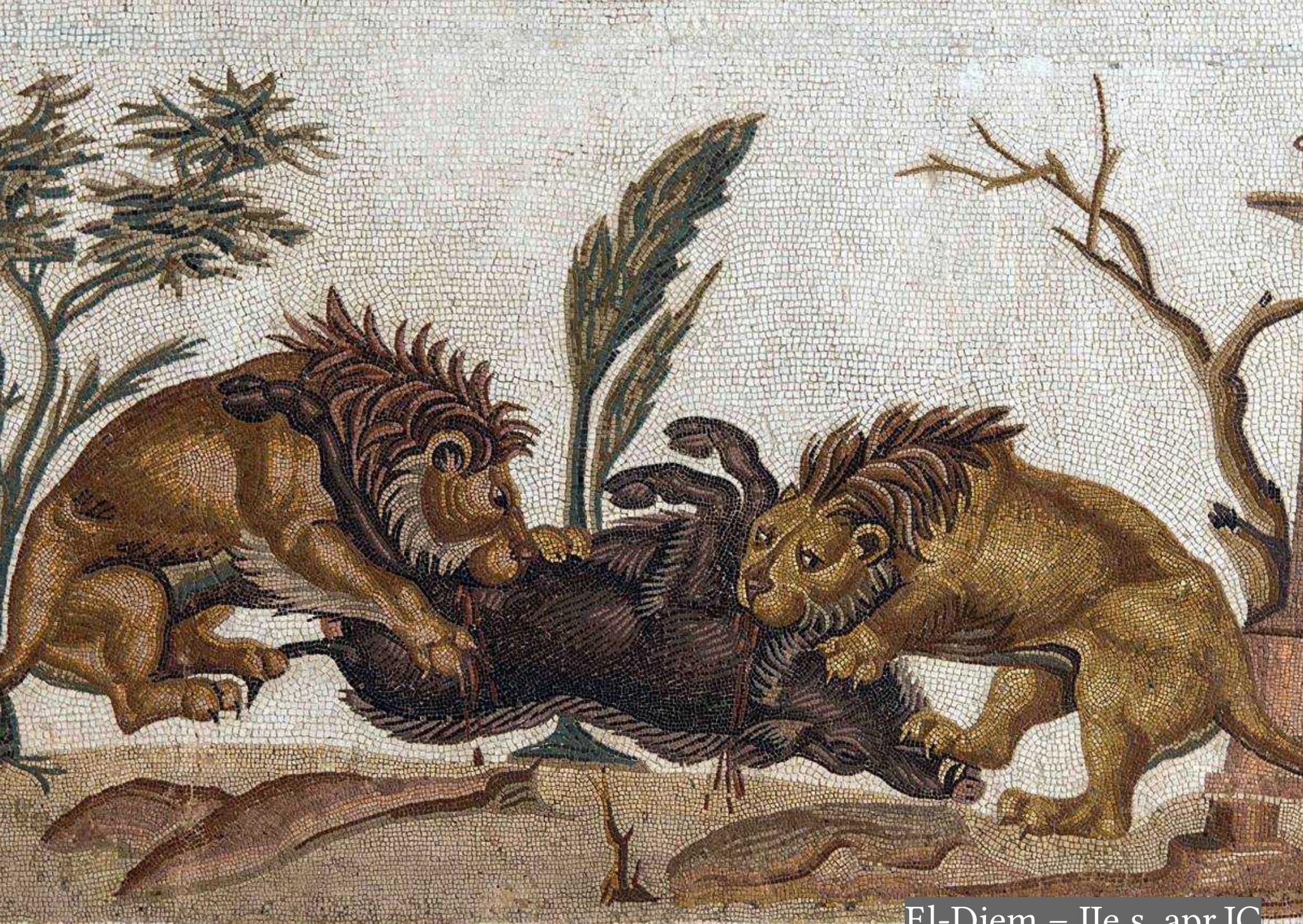
El-Djem – IIe s. apr.JC