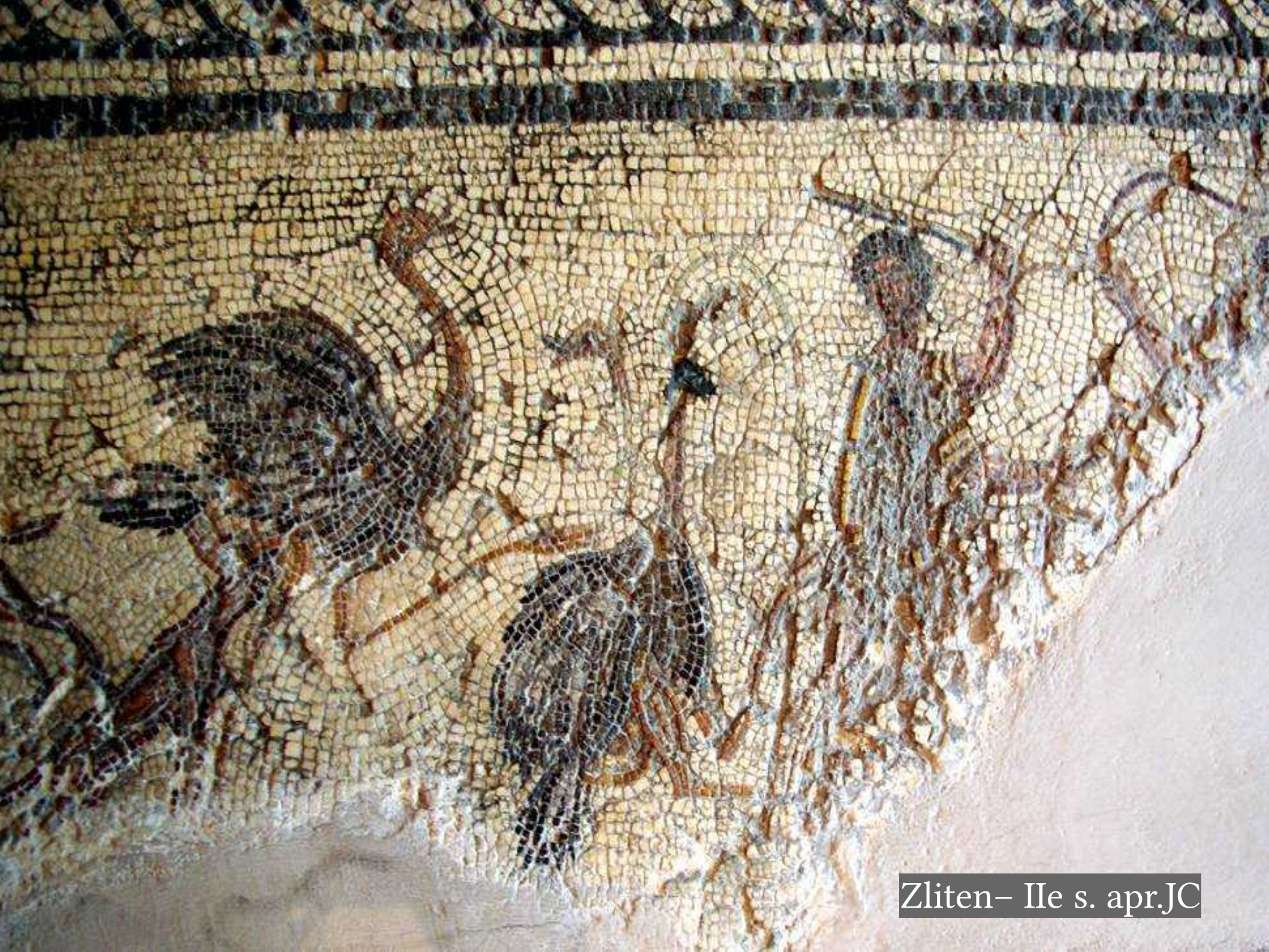
Zliten- IIe s. apr.JC