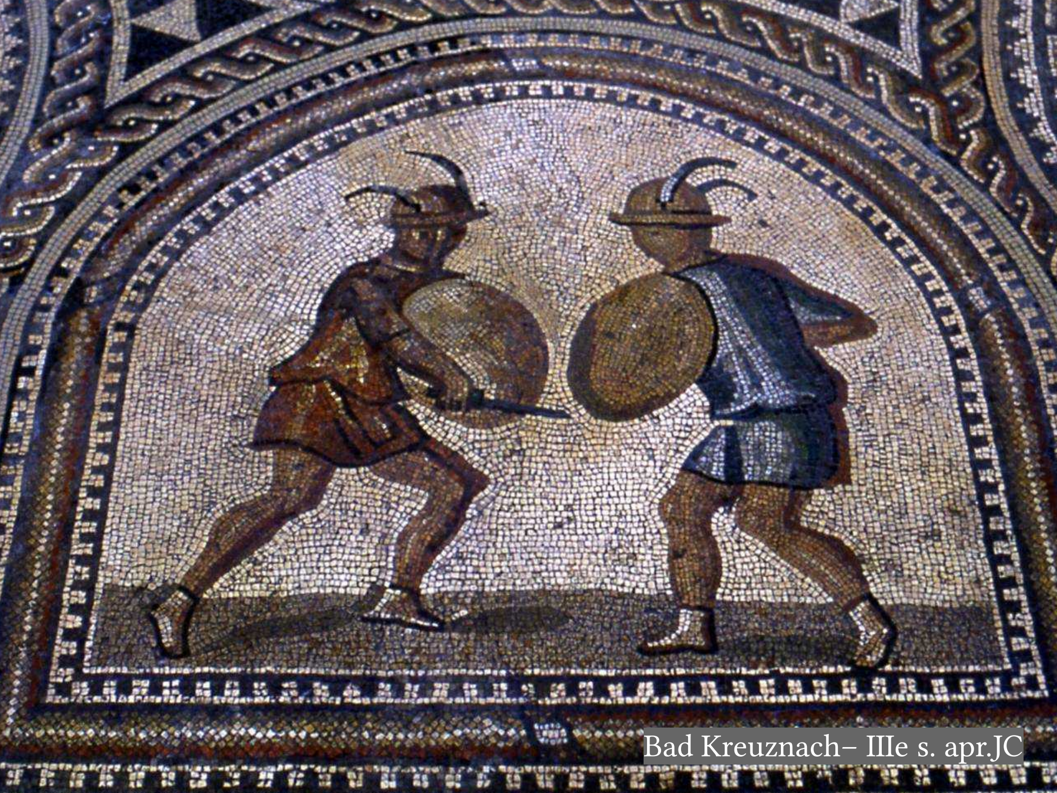
Bad Kreuznach– IIIe s. apr.JC