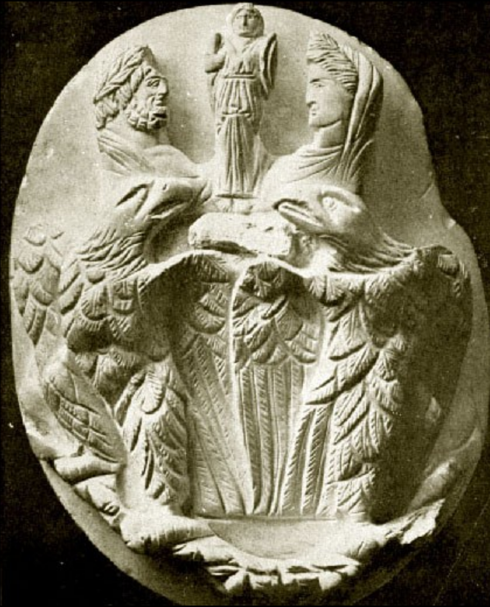
Camée Orghidan (Grand camée de Roumanie) - Apothéose de Julien l'Apostat ? Musée national d'Histoire de Bucarest