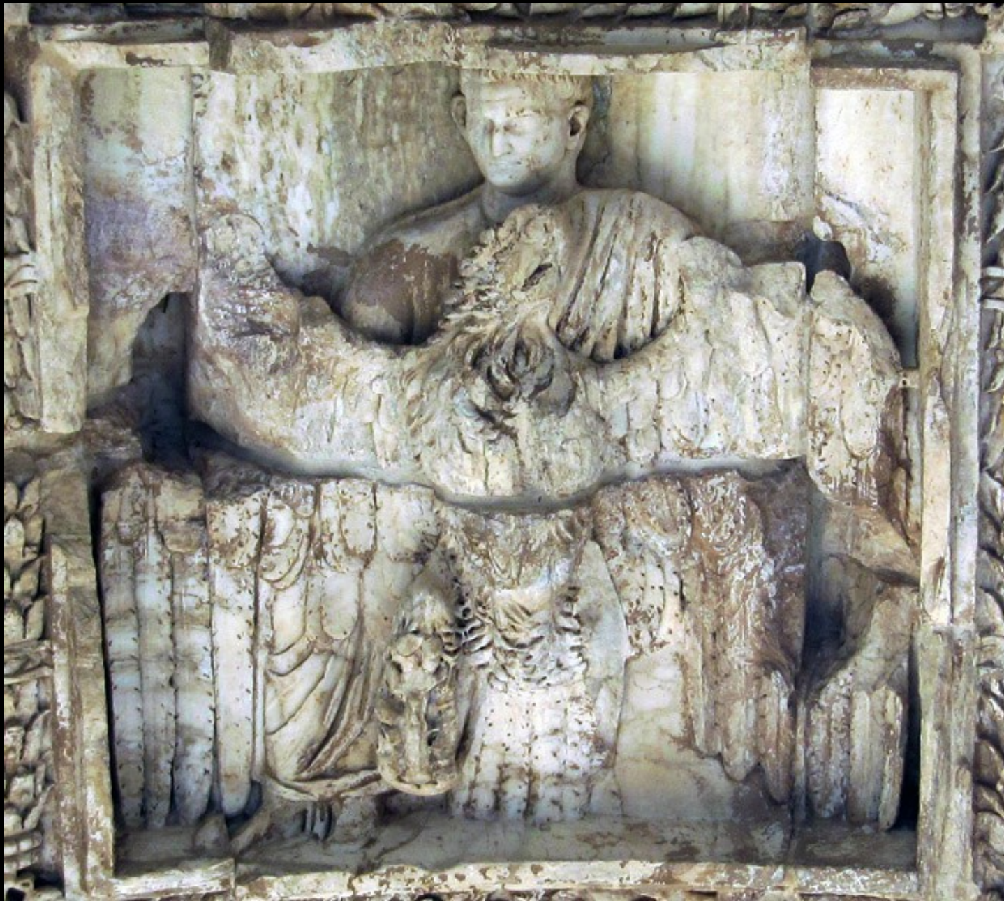
Plafond de l'arche de l'arc de triomphe de Titus (après 81 apr. JC) - Rome