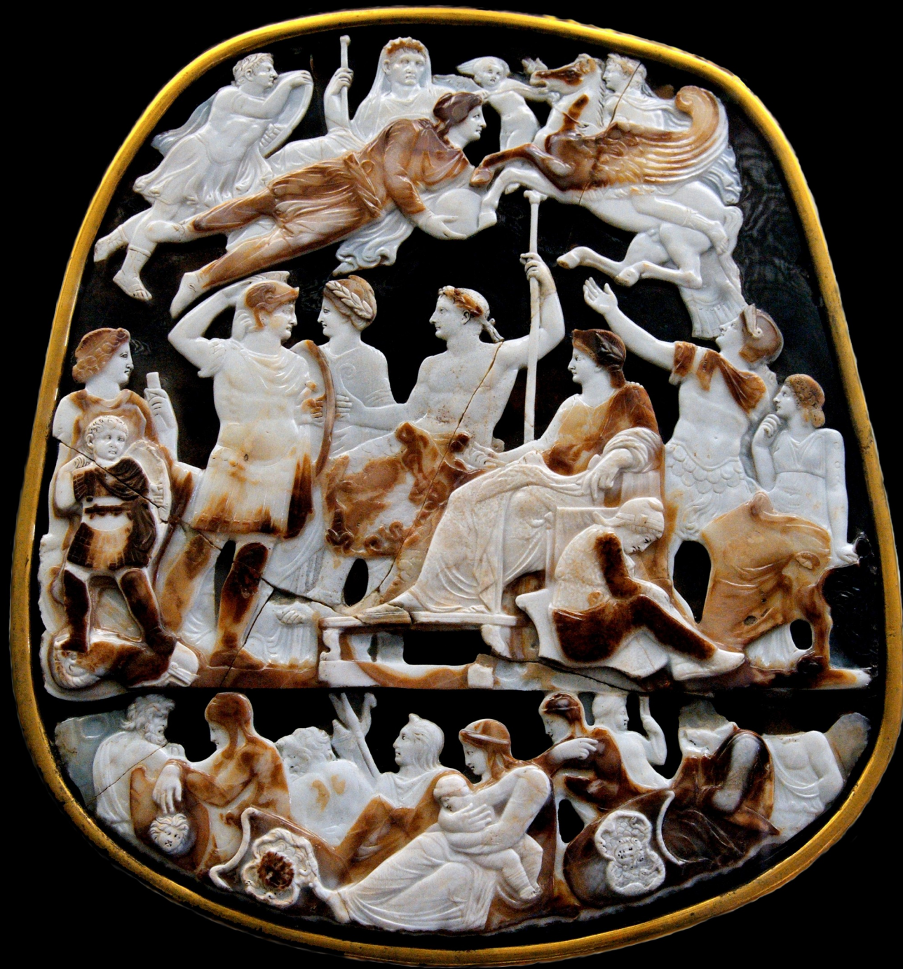
Auguste divus – Grand camée de France (v. 20 apr. JC) - Cabinet des médailles