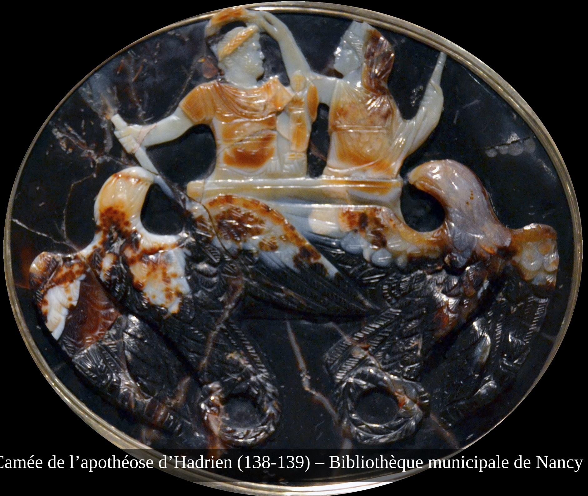
Camée de l'apothéose d'Hadrien (138-139) – Bibliothèque municipale de Nancy