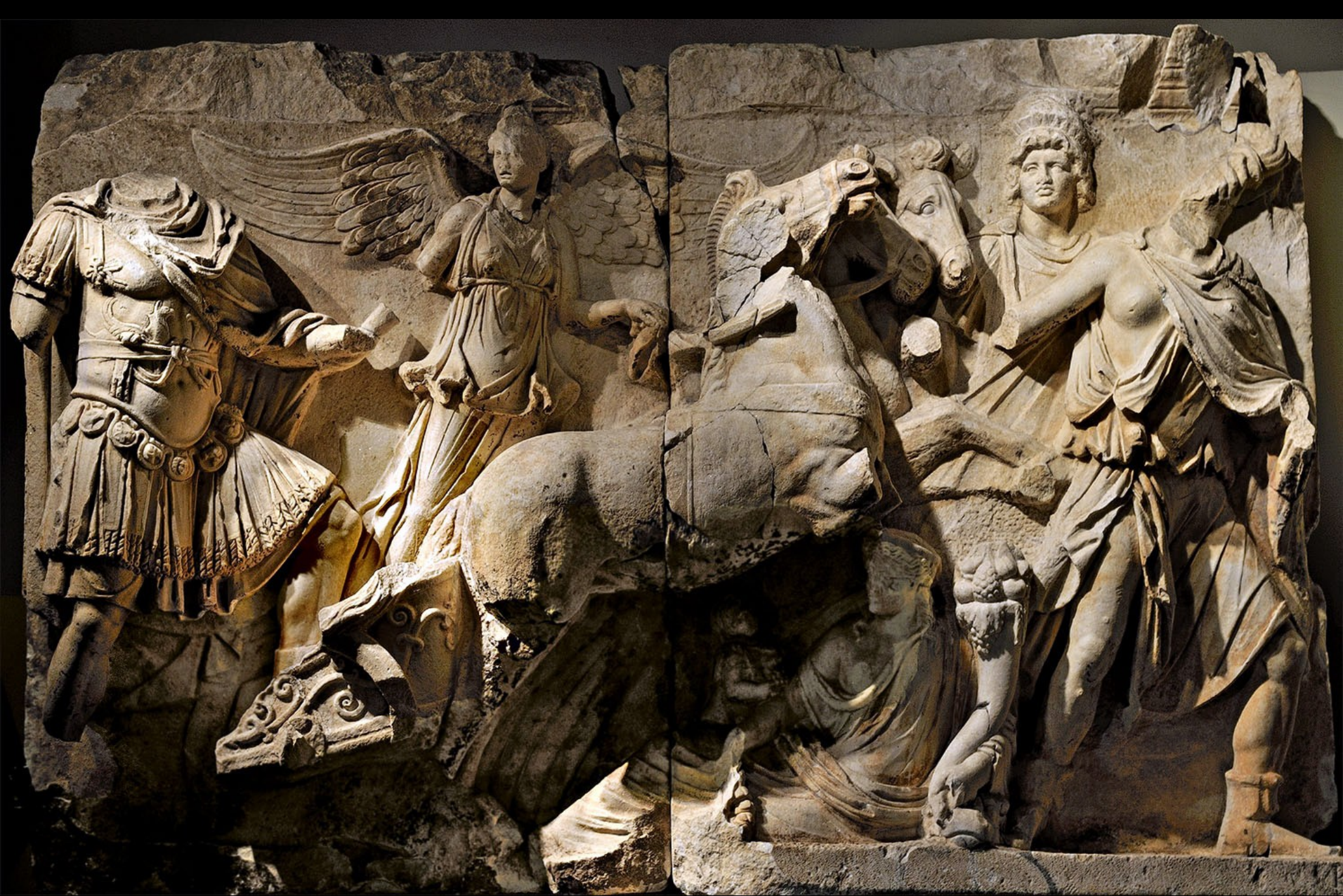
Bas-relief de l'apothéose de Lucius Verus (169) – Ephesos Museum, Vienne