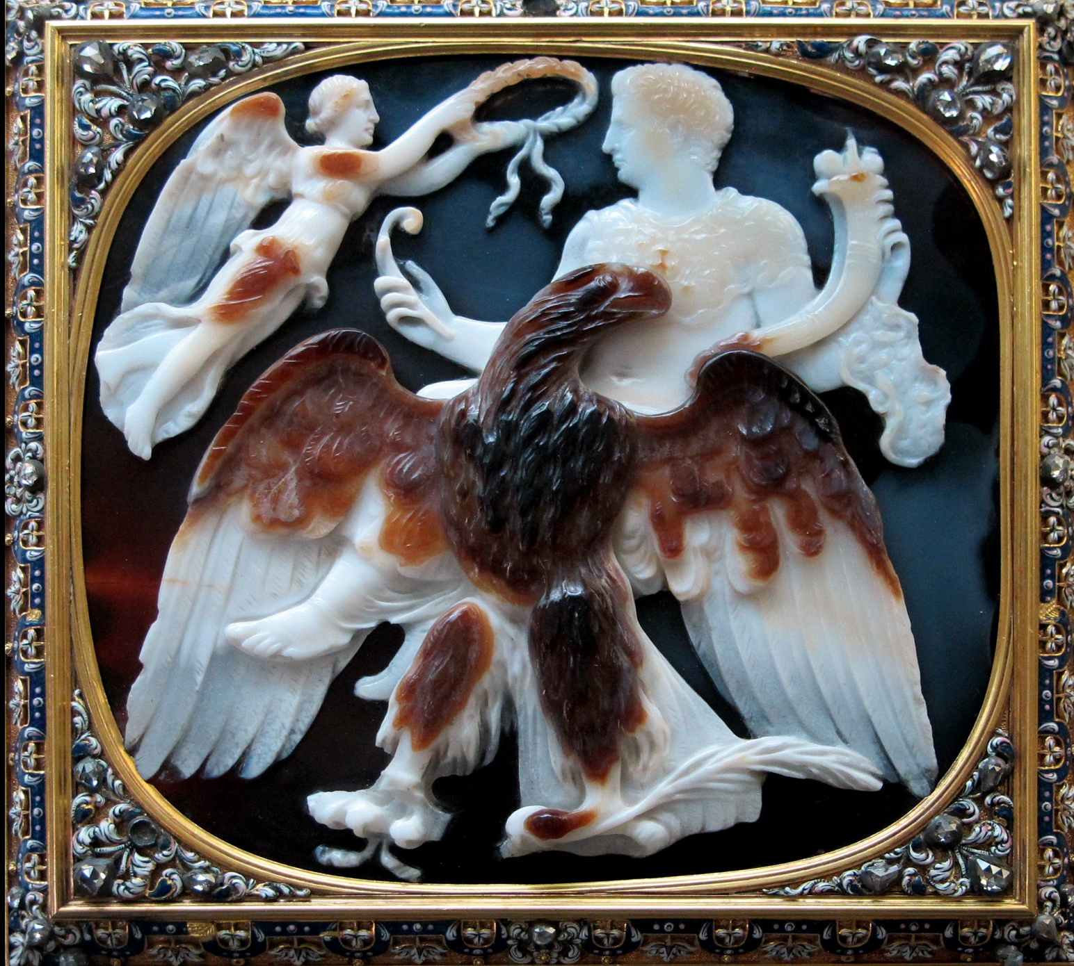
Camée de l'apothéose de Claude (54-55 apr. JC) - Cabinet des médailles