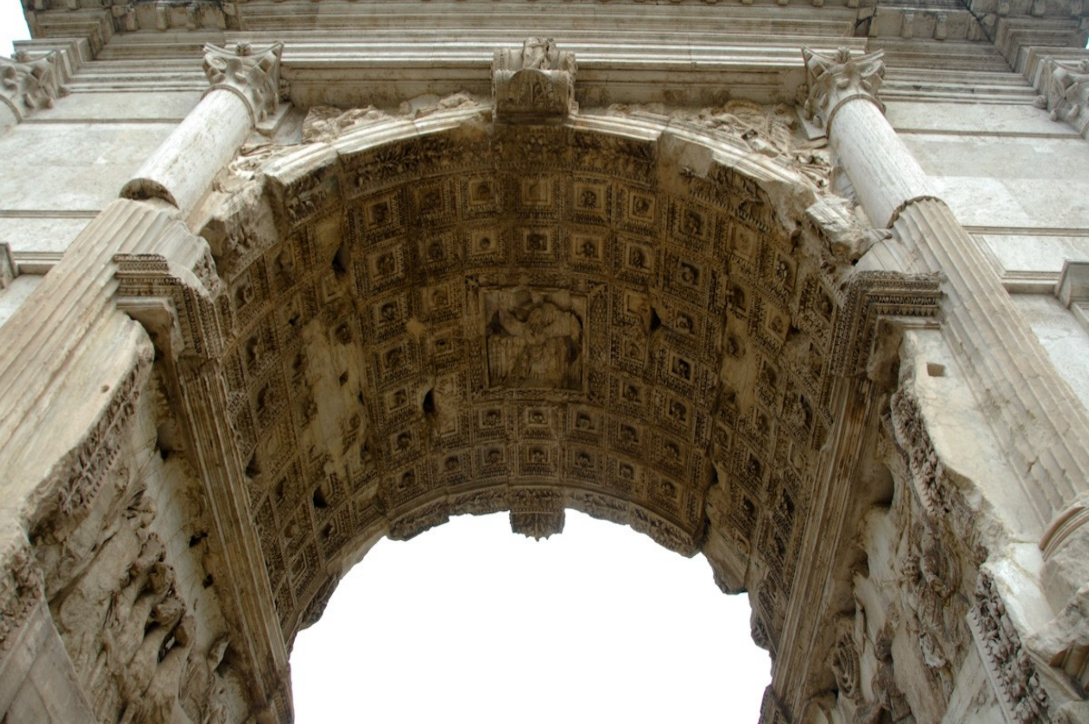
Plafond de l'arche de l'arc de triomphe de Titus (après 81 apr. JC) - Rome