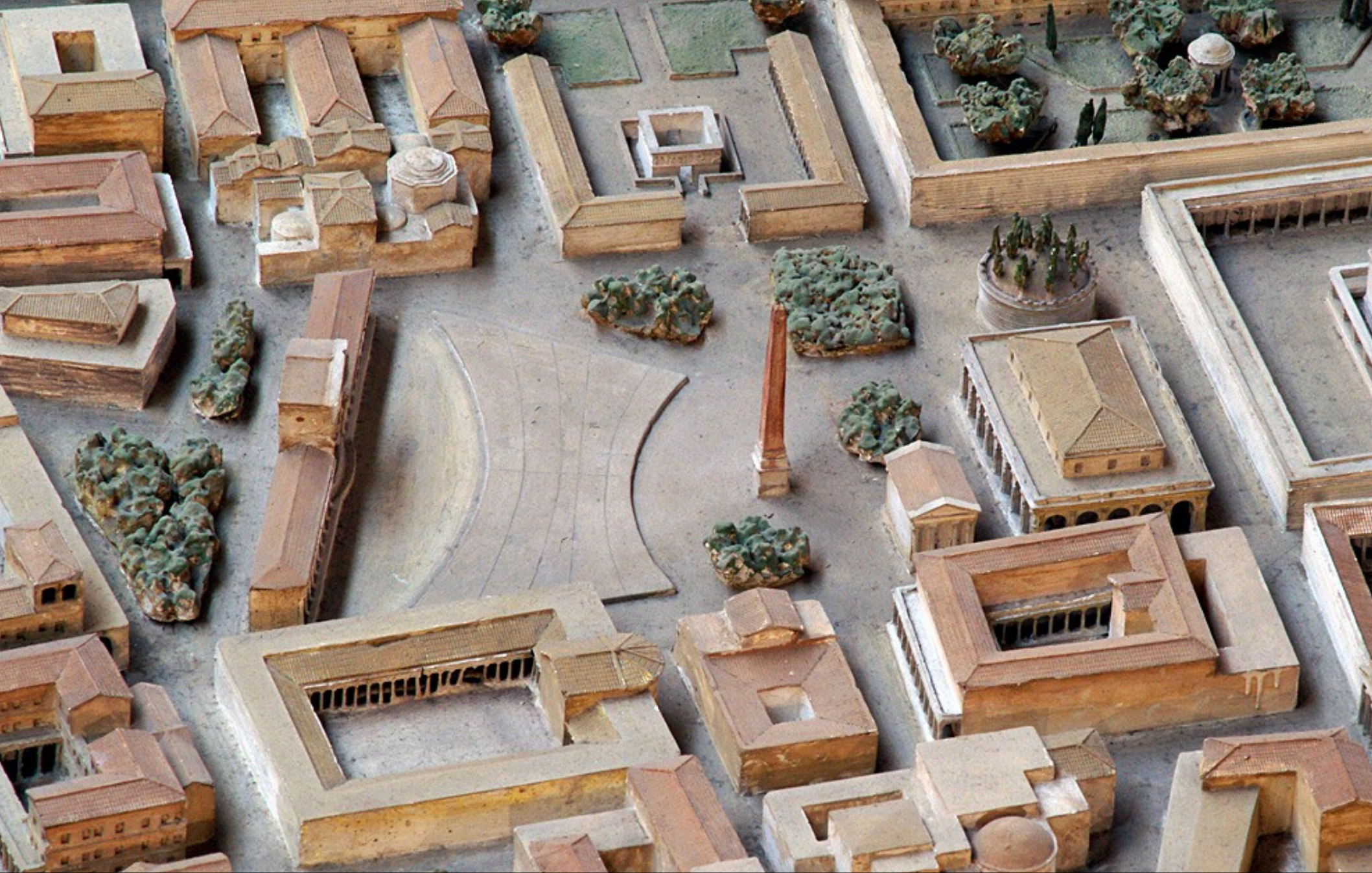
CADRAN SOLAIRE D'AUGUSTE – 10 AV. J.C – ROME GNOMON = OBÉLISQUE DE PSAMMÉTIQUE II