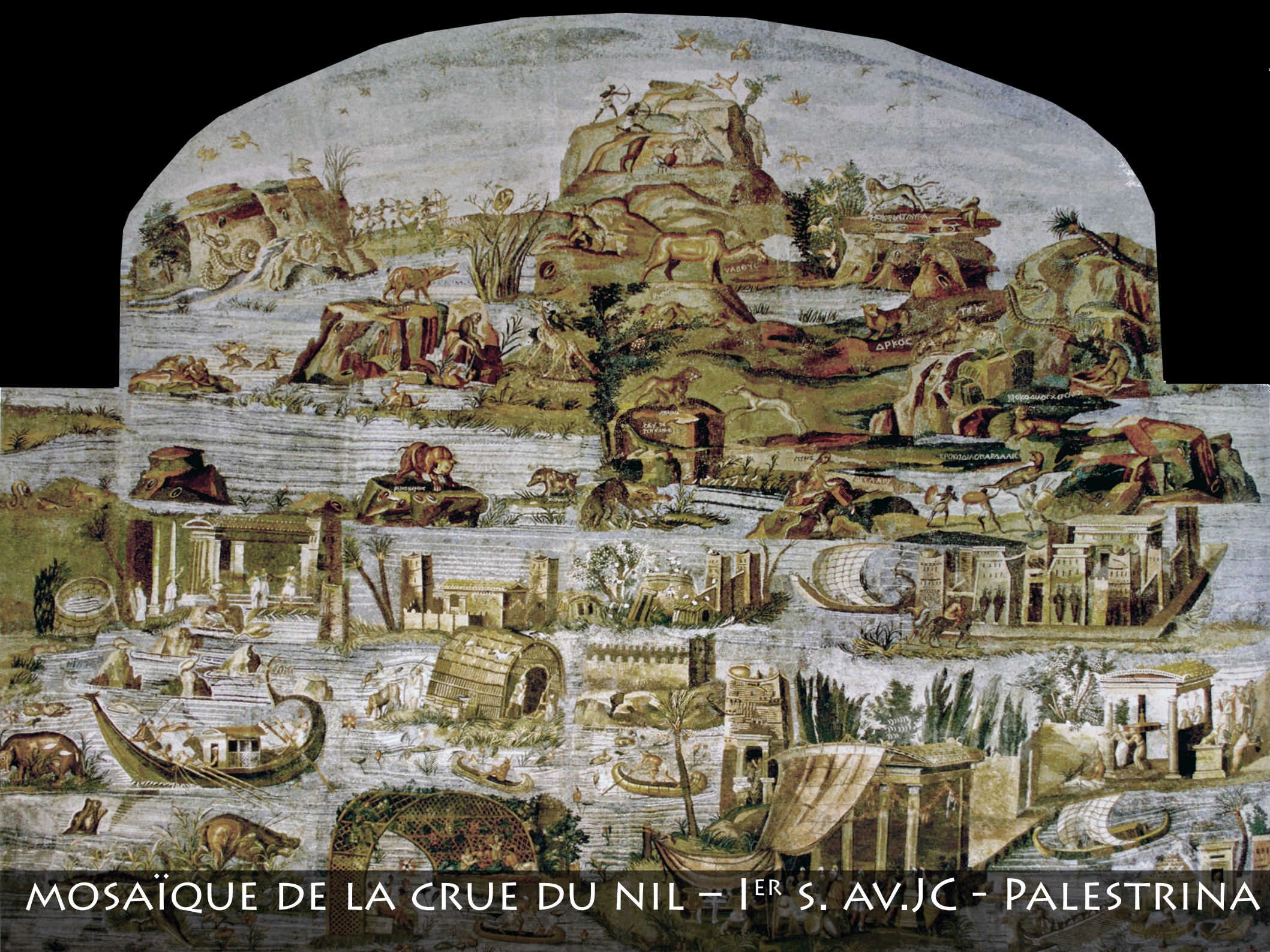
MOSAÏQUE DE LA CRUE DU NIL – I ER S. AV. JC – PALESTRINA