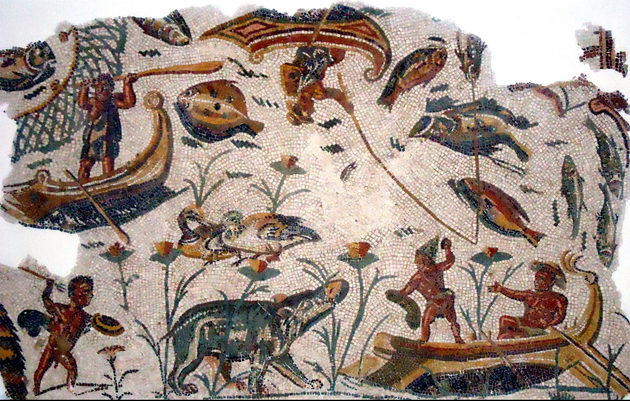
MOSAÏQUE NILOTIQUE – III E S. APR. JC - SOUSSE