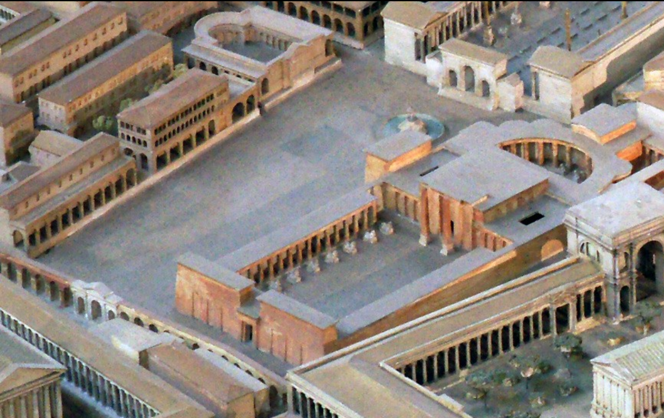
TEMPLE D'ISIS ET SÉRAPIS – 43 AV. JC / 38 APR. JC CHAMP DE MARS - ROME