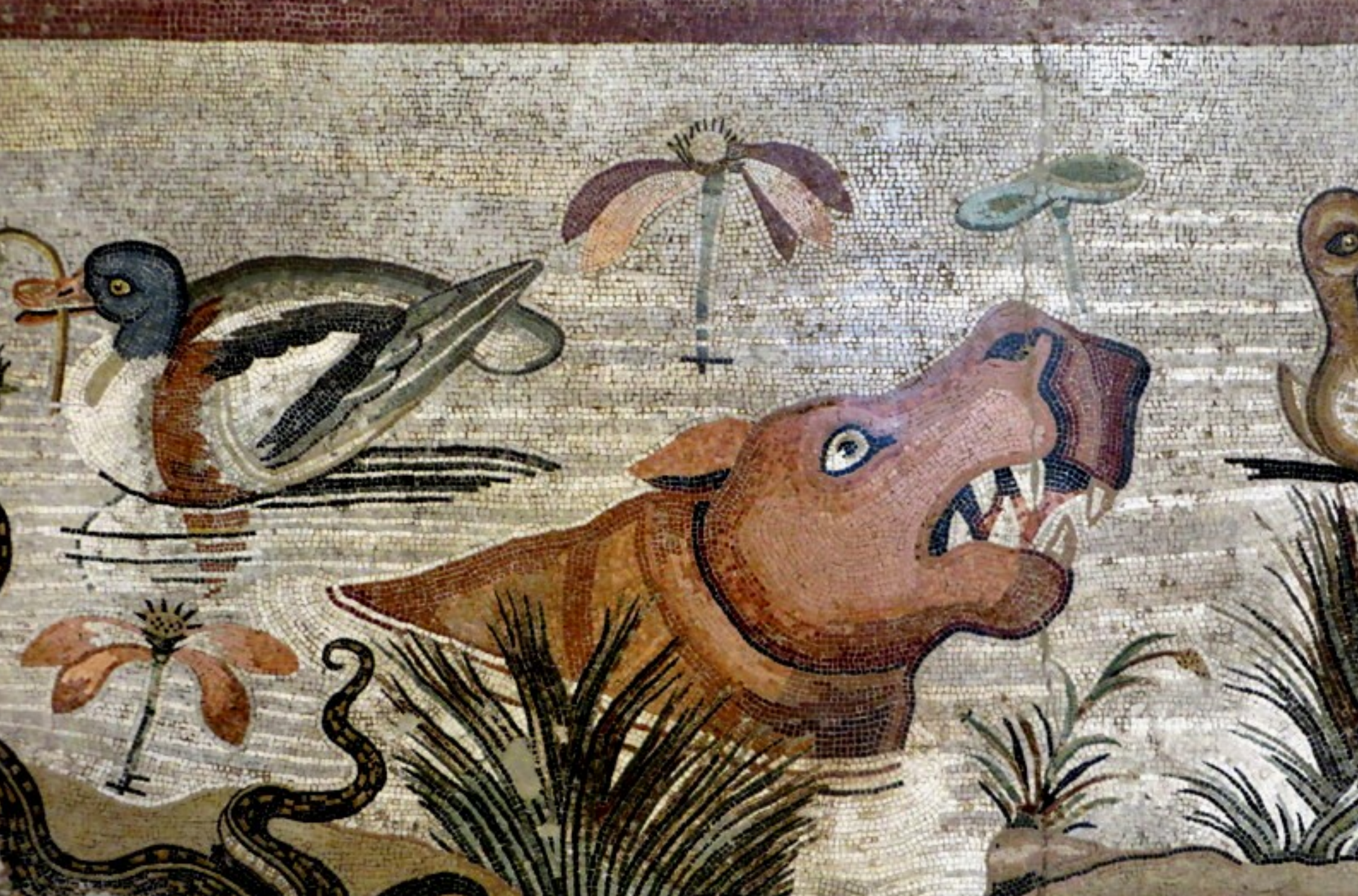
MOSAÏQUE NILOTIQUE – I ER S. APR. J.C – POMPÉI