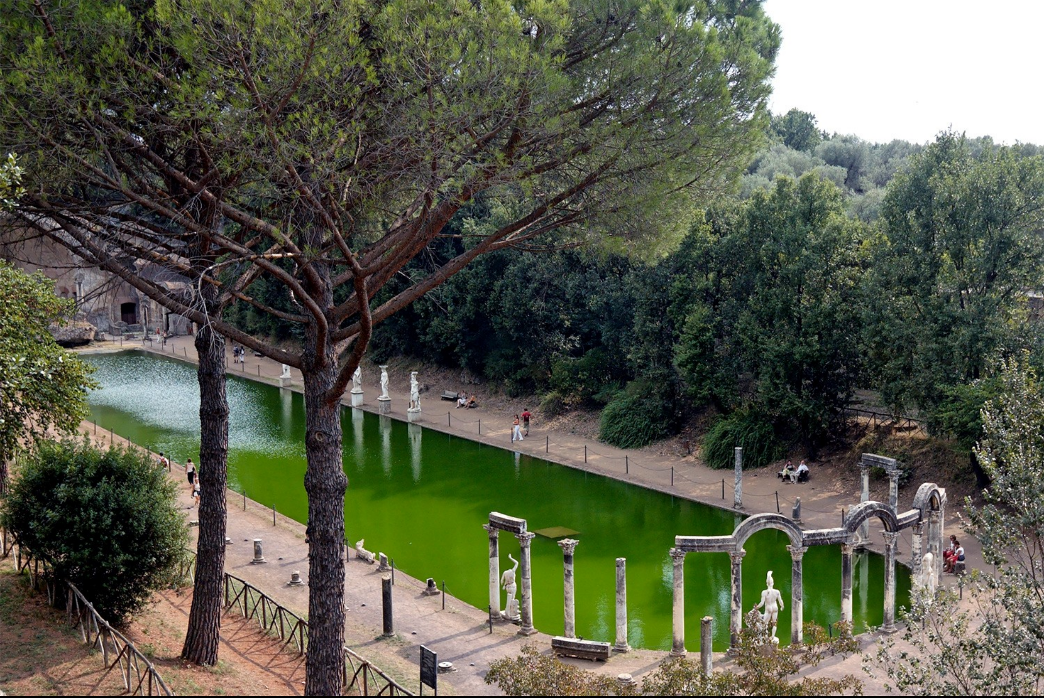
BASSIN DE CANOPE – VILLA HADRIANA – 118-138 APR. JC