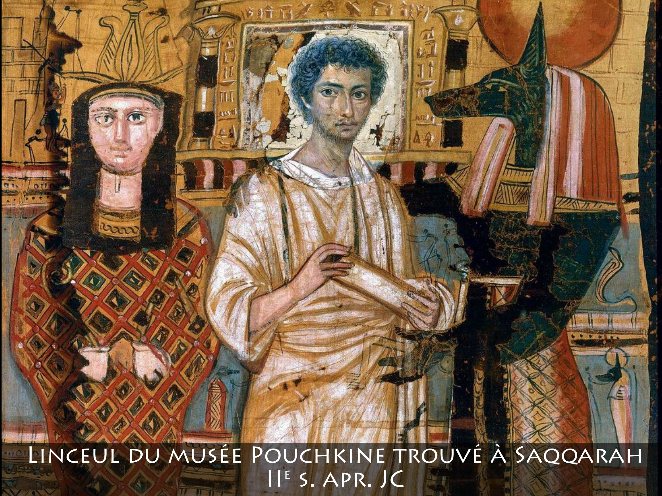
LINCEUL DU MUSÉE POUCHKINE TROUVÉ À SAQQARAH II E S. APR. JC