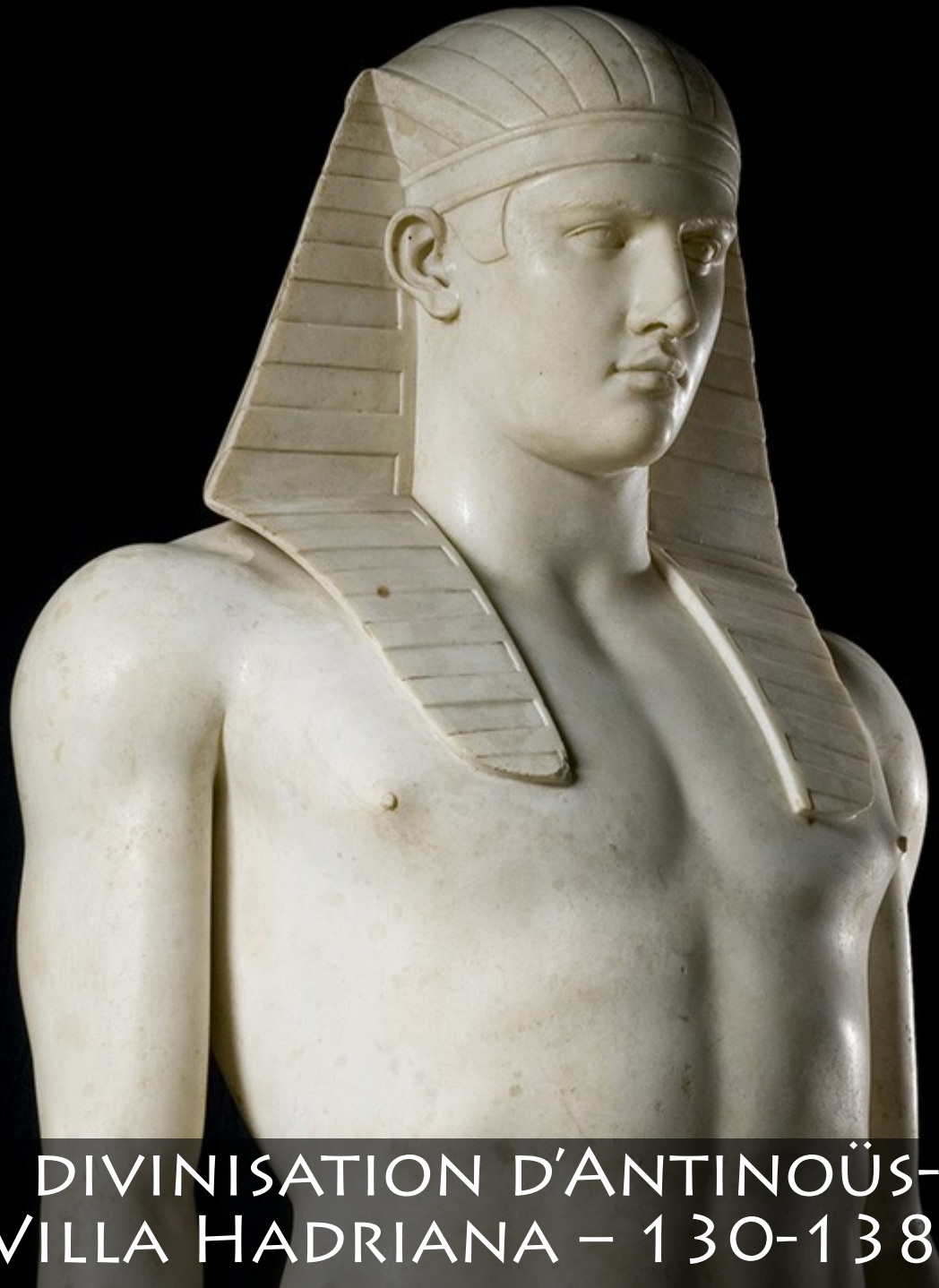
DIVINISATION D'ANTINOÛS-OSIRIS VILLA HADRIANA – 130-138 APR. JC