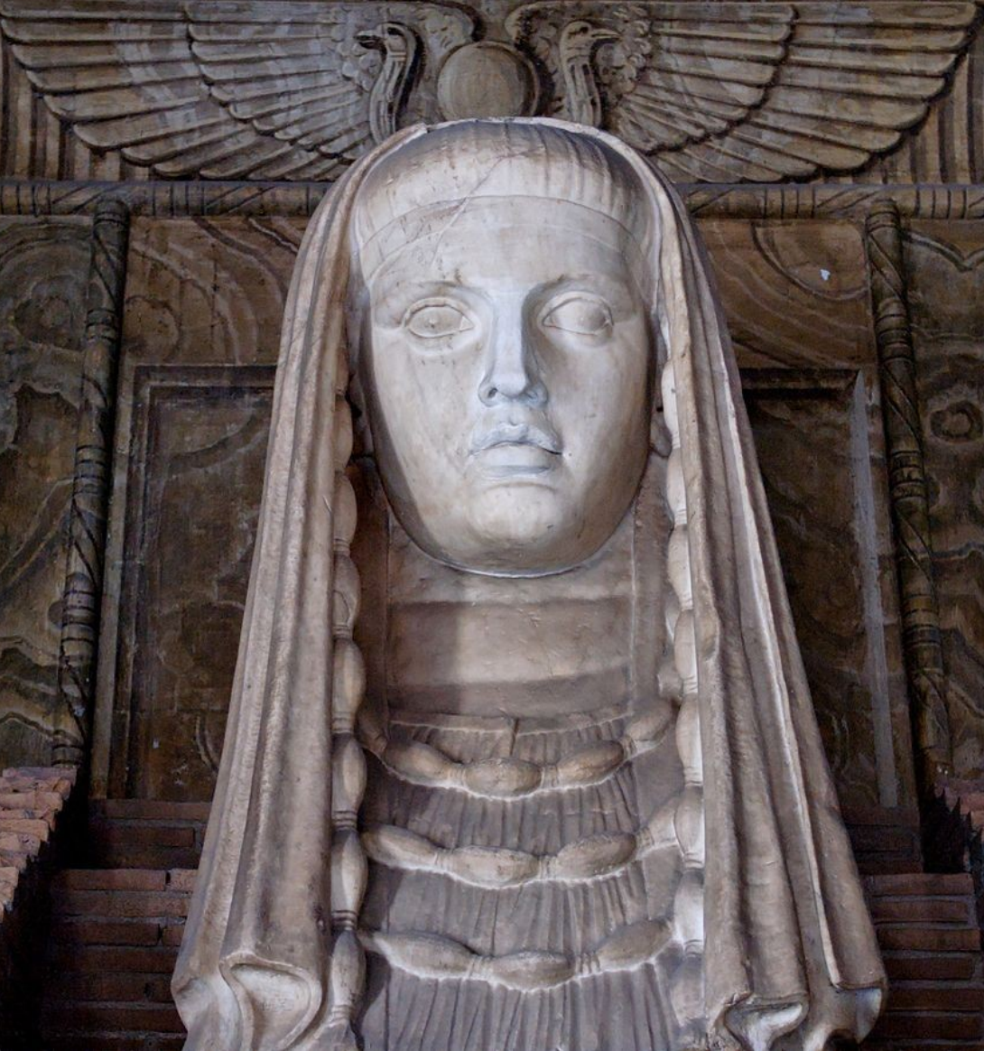
STATUES D'ISIS PROVENANT DE LA VILLA HADRIANA 117-38 APR. JC