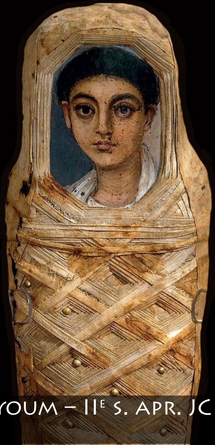
MASQUES FUNÉRAIRES DU FAYOUM – II E S. APR. JC