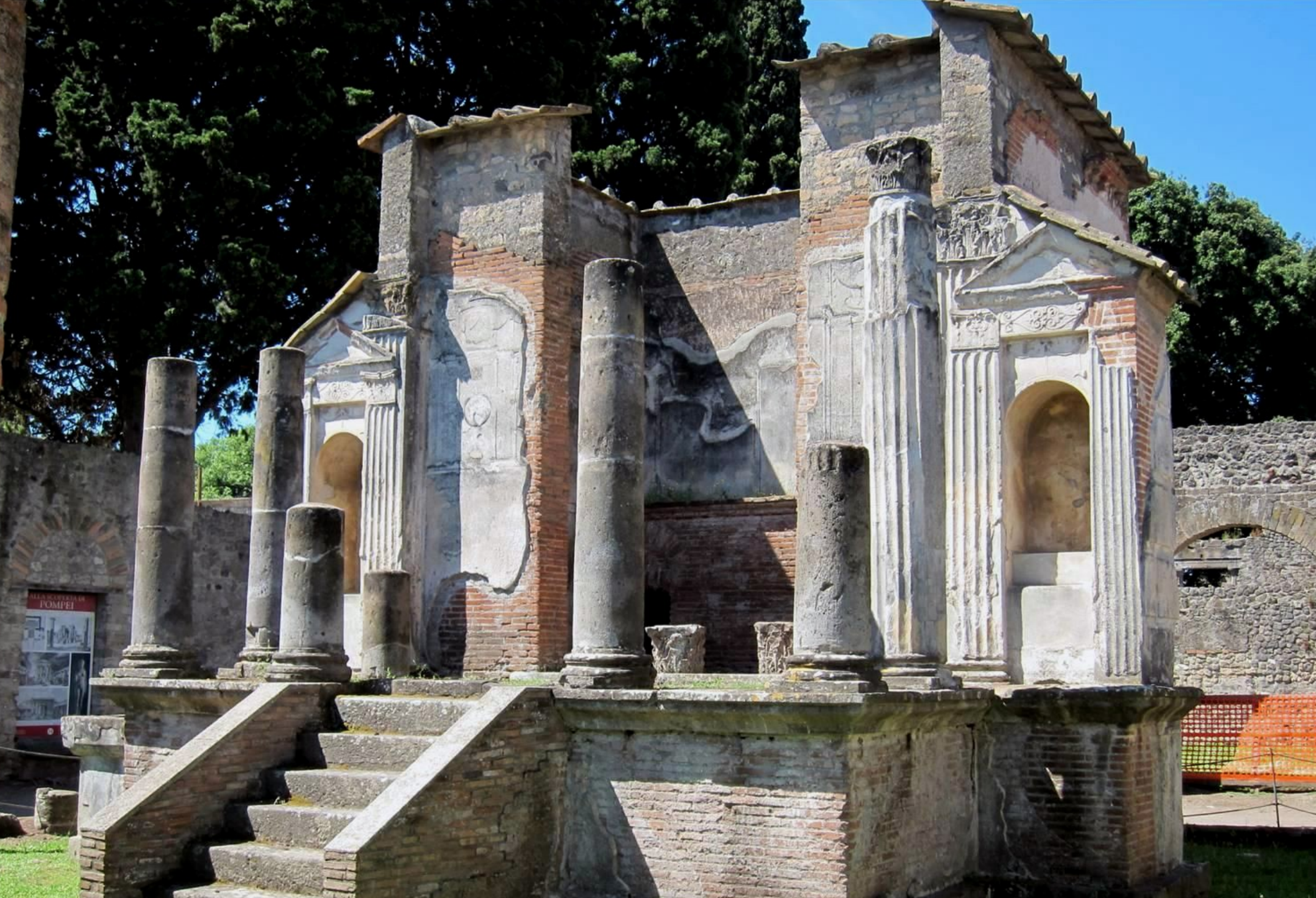
TEMPLE D'ISIS À POMPÉI – IIE S. AV.JC / 62 PUIS 79 APR.JC