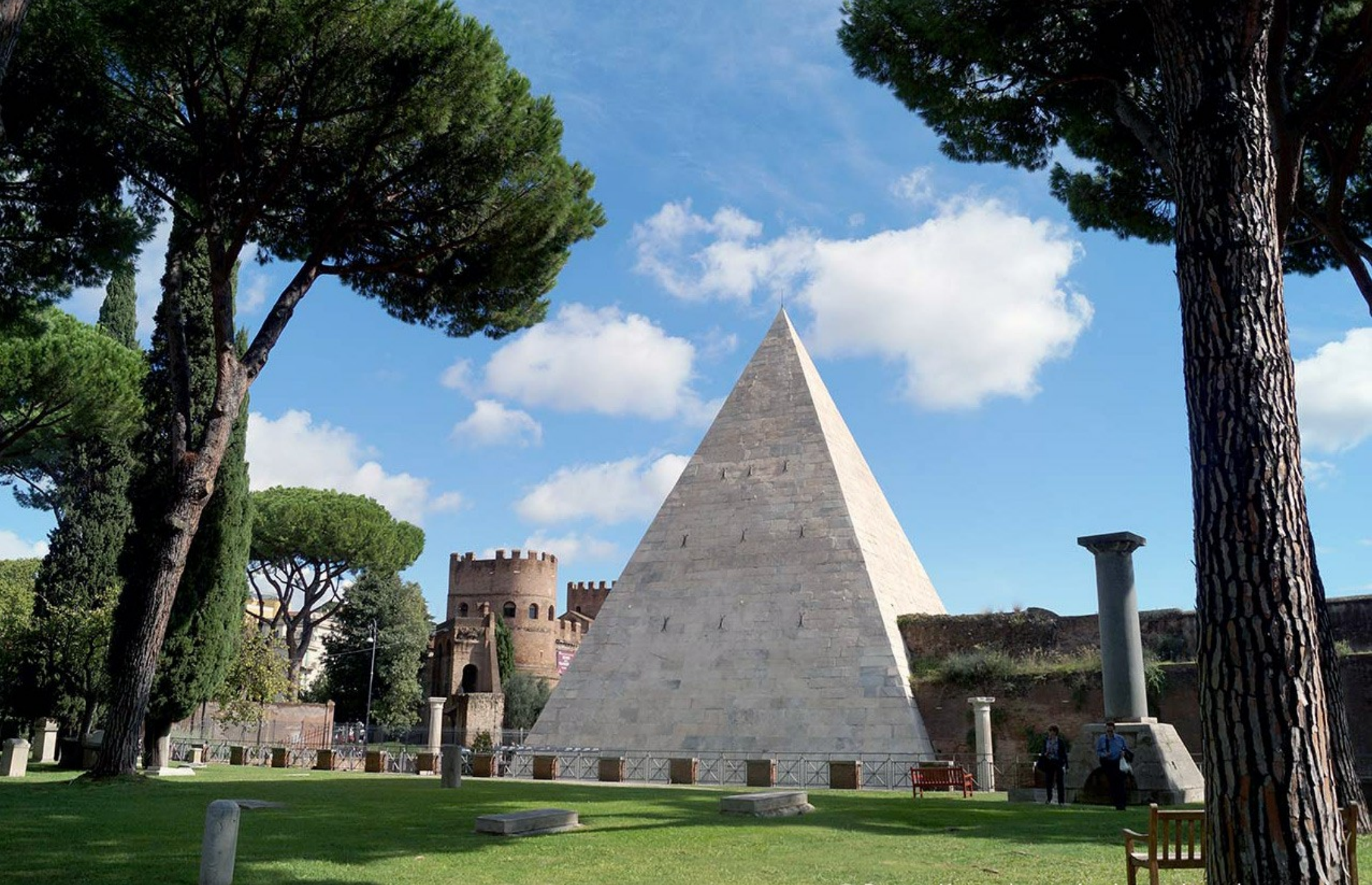
PYRAMIDE DE CAIUS CESTIUS – 18-12 AV. JC - ROME