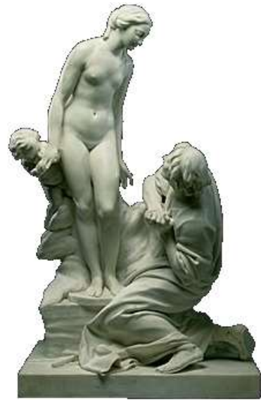
Falconnet - Pygmalion (1761)