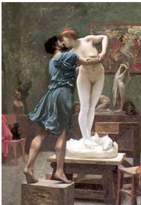
Jean-Léon Gérôme - Pygmalion et Galatée (1892)