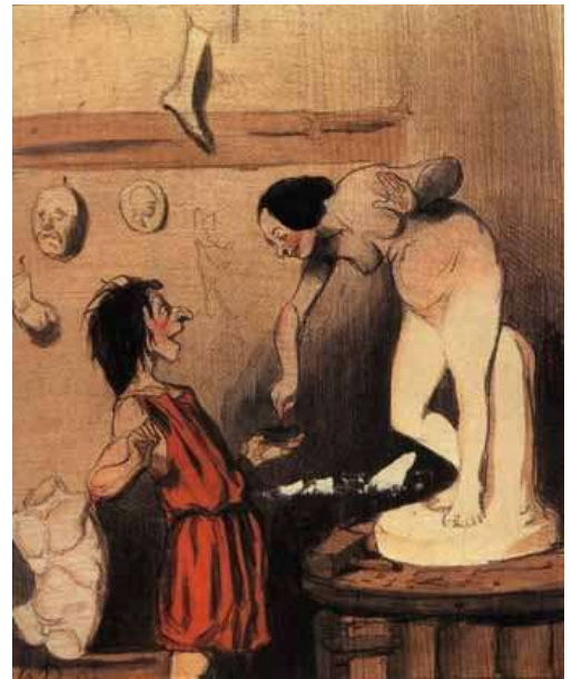
Honoré Daumier - Charivari (1842)