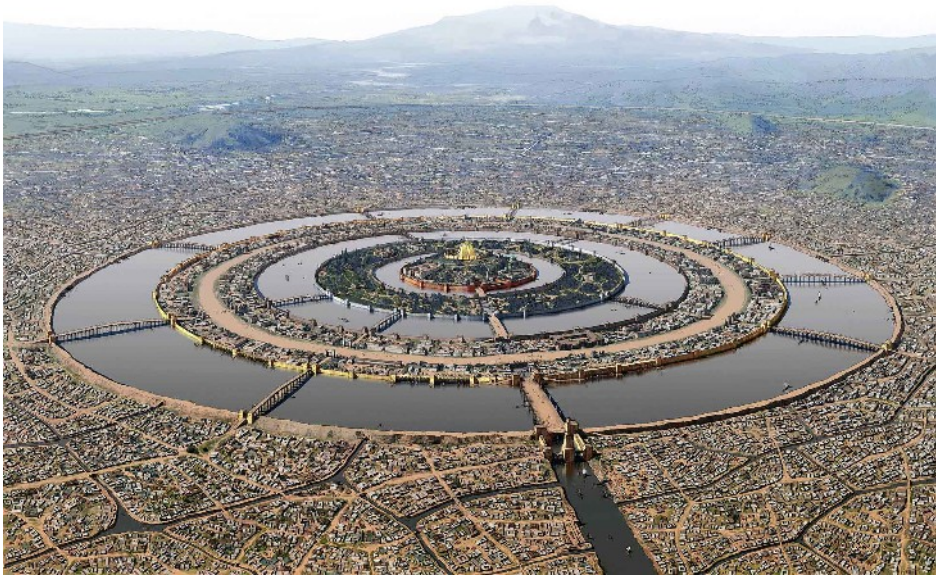
Une interprétation moderne de l'ancienne Atlantide

Comme dans le mythe de l'Atlantide de Platon, les indications chiffrées ainsi que les mesures mathématiques et géométriques font partie des principales caractéristiques de l'Utopia. En effet, ce lieu est une pure construction intellectuelle et imaginaire. Il est donc soumis au « logos », à l'esprit raisonnant de l'auteur.