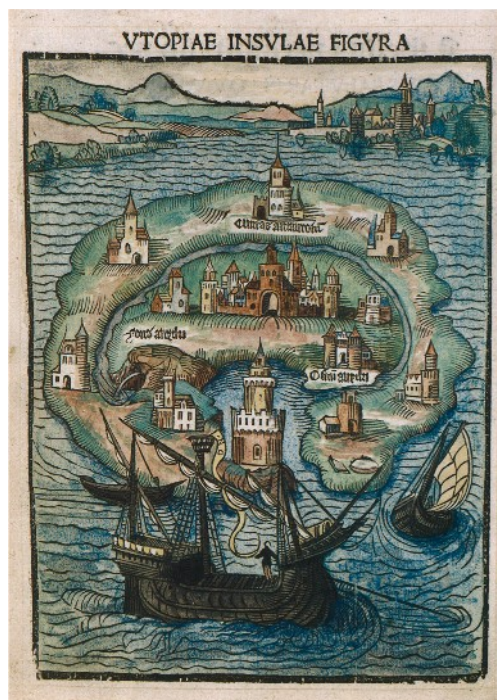
Gravure sur bois – Edition de 1516