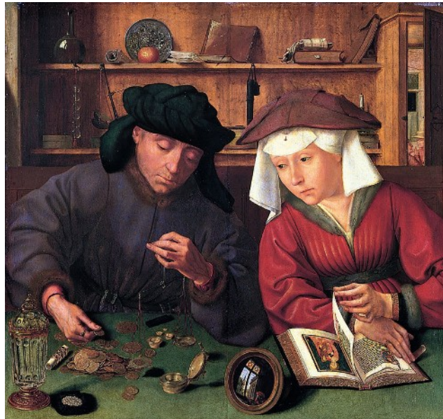
Quentin Metsys - Le prêteur et sa femme – 1514 Musée du Louvre

Eux-mêmes ne font aucun usage de la monnaie. Ils la gardent pour un événement qui peut survenir, qui peut aussi ne jamais se présenter. Cet or et cet argent, ils les conservent chez eux sans leur attacher plus de valeur que n'en comporte leur nature propre. Et qui ne voit qu'elle est bien inférieure à celle du fer, sans lequel les mortels ne pourraient vivre, pas plus qu'ils ne sauraient se passer de l'eau ou du feu, alors que tout au contraire la nature n'a attaché à l'or et à l'argent aucune propriété qui nous serait précieuse, si la sottise des hommes n'ajoutait du prix à ce qui est rare ? La nature, comme la plus généreuse des mères, a mis à notre portée immédiate ce qu'elle nous a donné de meilleur, comme l'air, l'eau, la terre elle-même ; tandis qu'elle écarte de nous les choses vaines et inutiles.