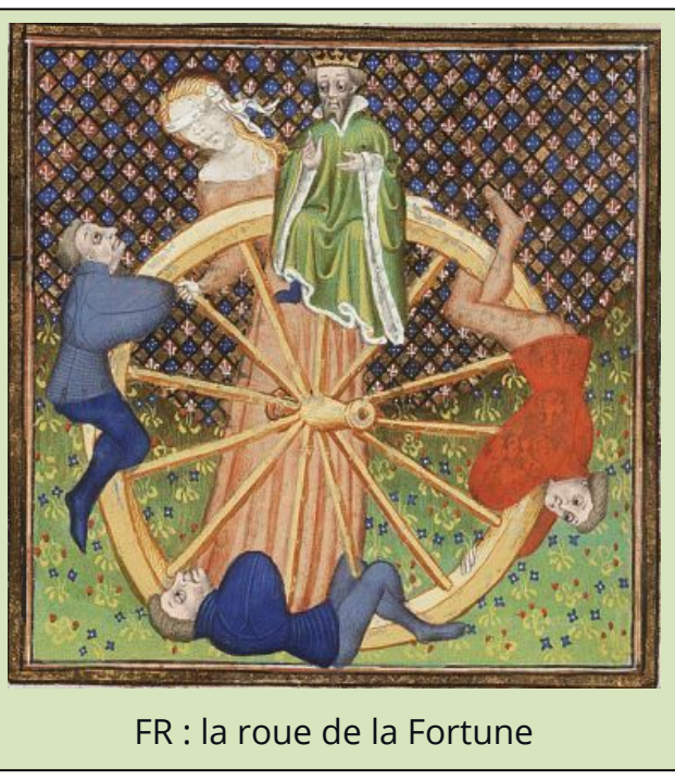
FR : la roue de la Fortune