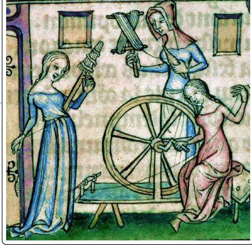
FR : les Fées

les Parques (divinités du Destin) = Moires en Grèce