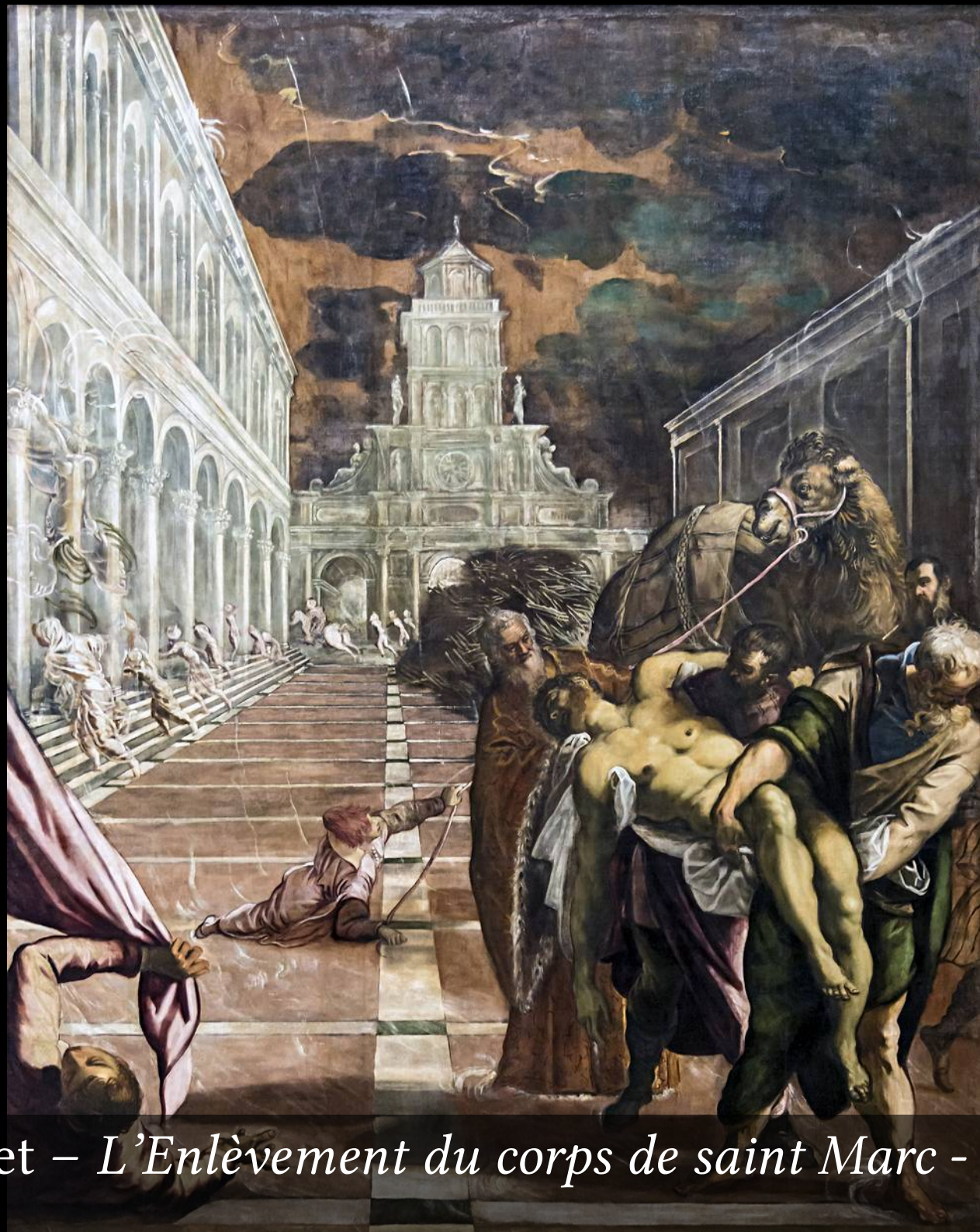
Le Tintoret – L'Enlèvement du corps de saint Marc - 1562-1566