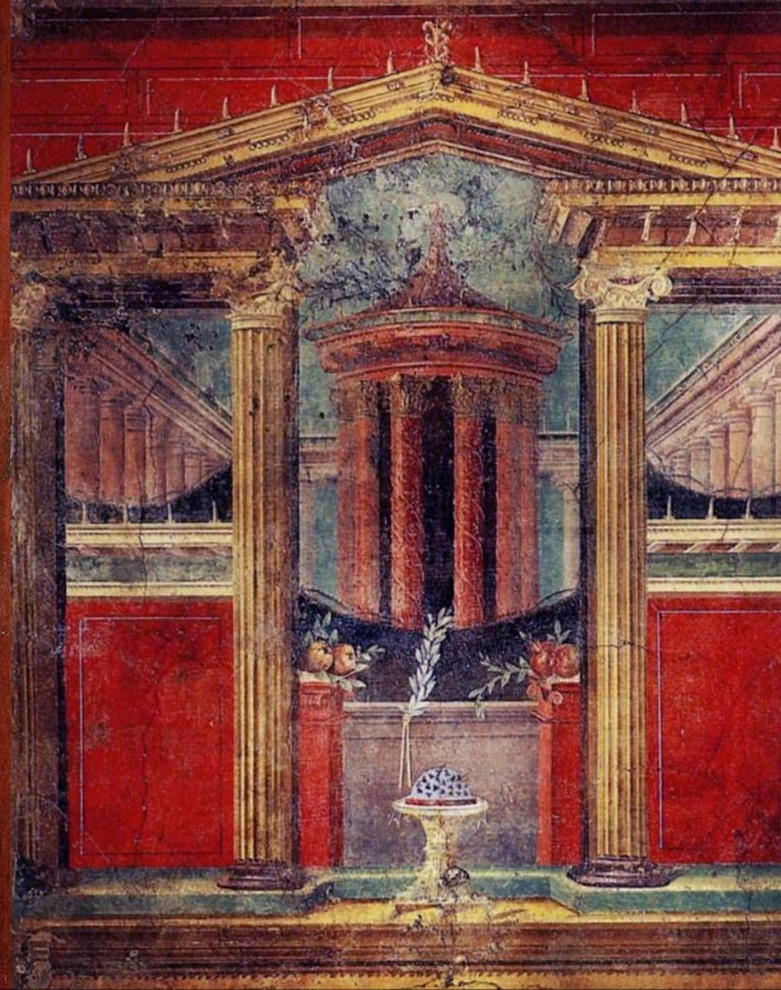
Trompe-l'œil de Pompéi et Boscoreale – I er s. apr. JC