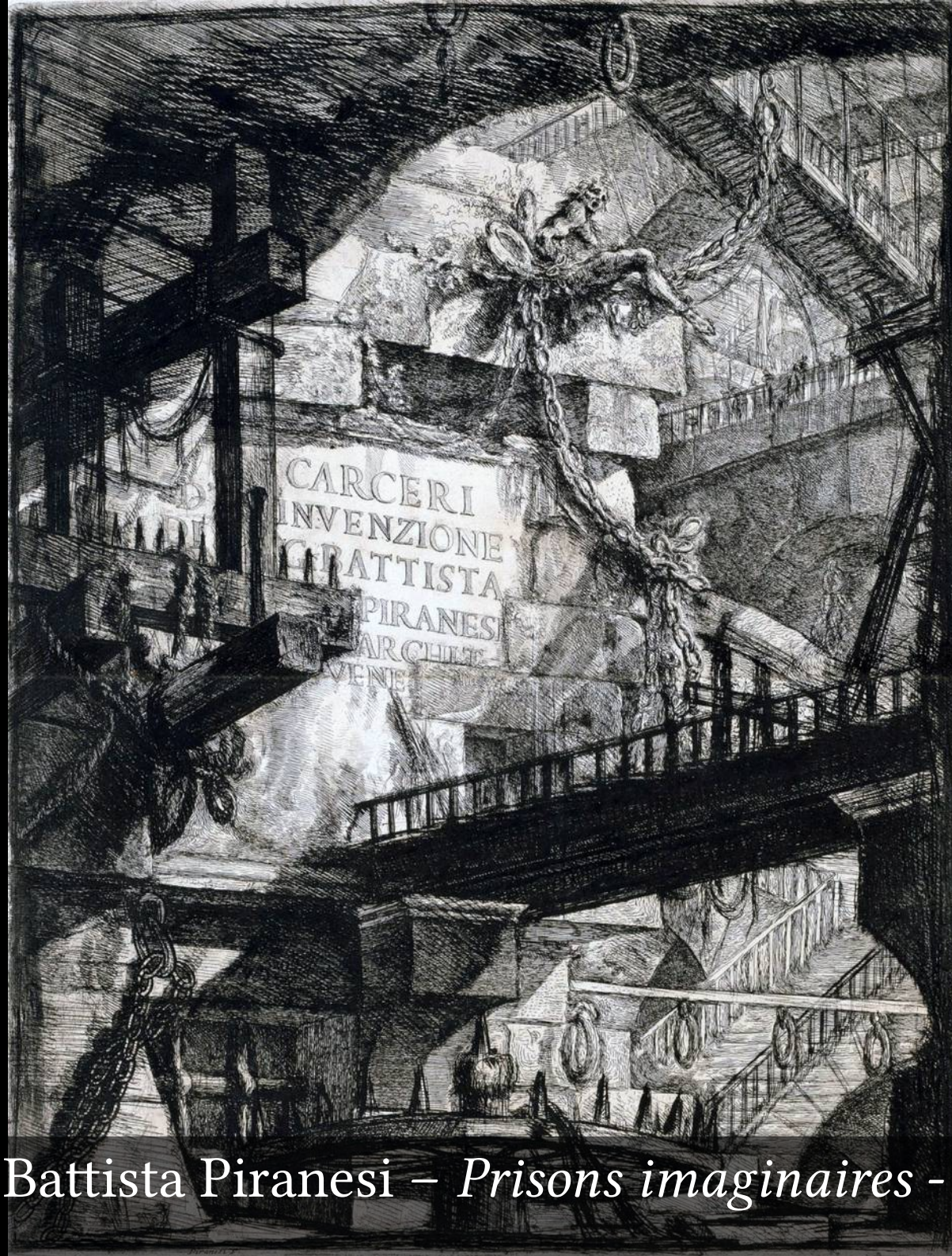
Giovanni Battista Piranesi – Prisons imaginaires - 1750-1761