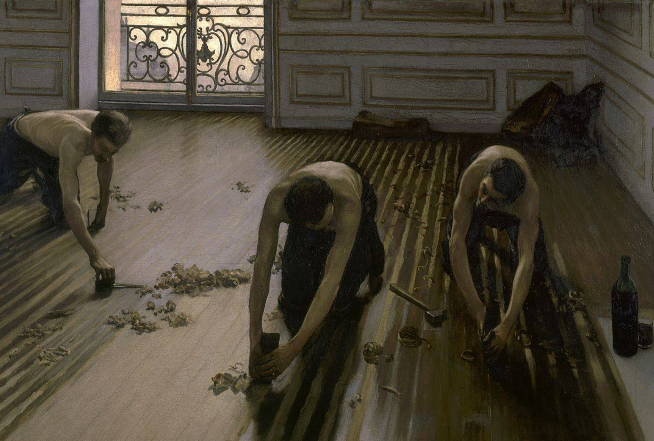
Gustave Caillebotte – Les Raboteurs de parquet - 1875