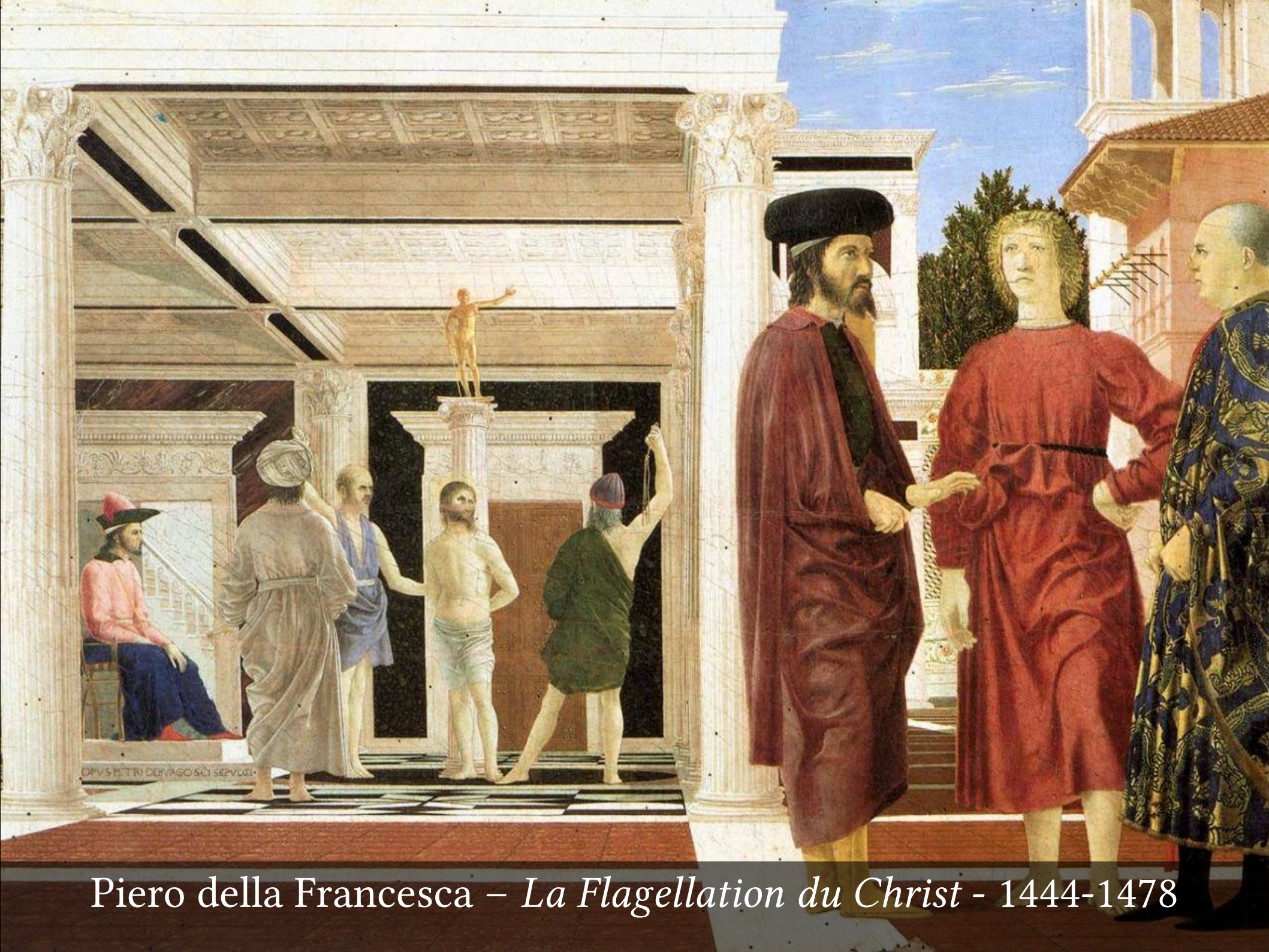
Piero della Francesca – La Flagellation du Christ - 1444-1478