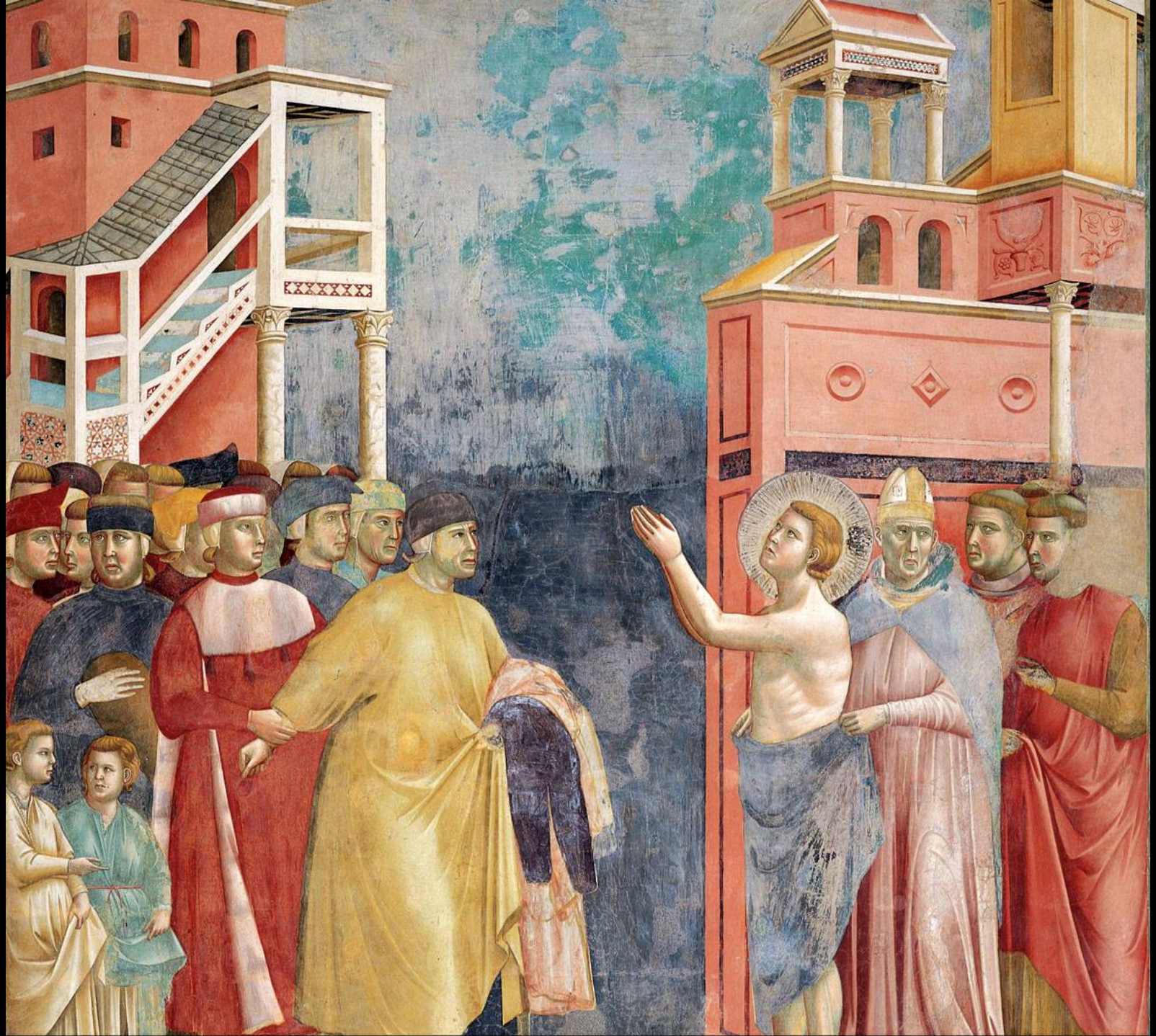
Giotto – Saint François renonce aux biens de ce monde - 1297-1299