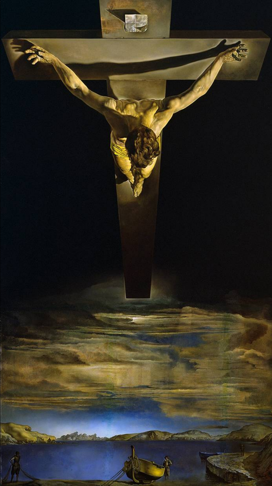
Salvador Dalí – Le Christ de Saint Jean de la Croix - 1951