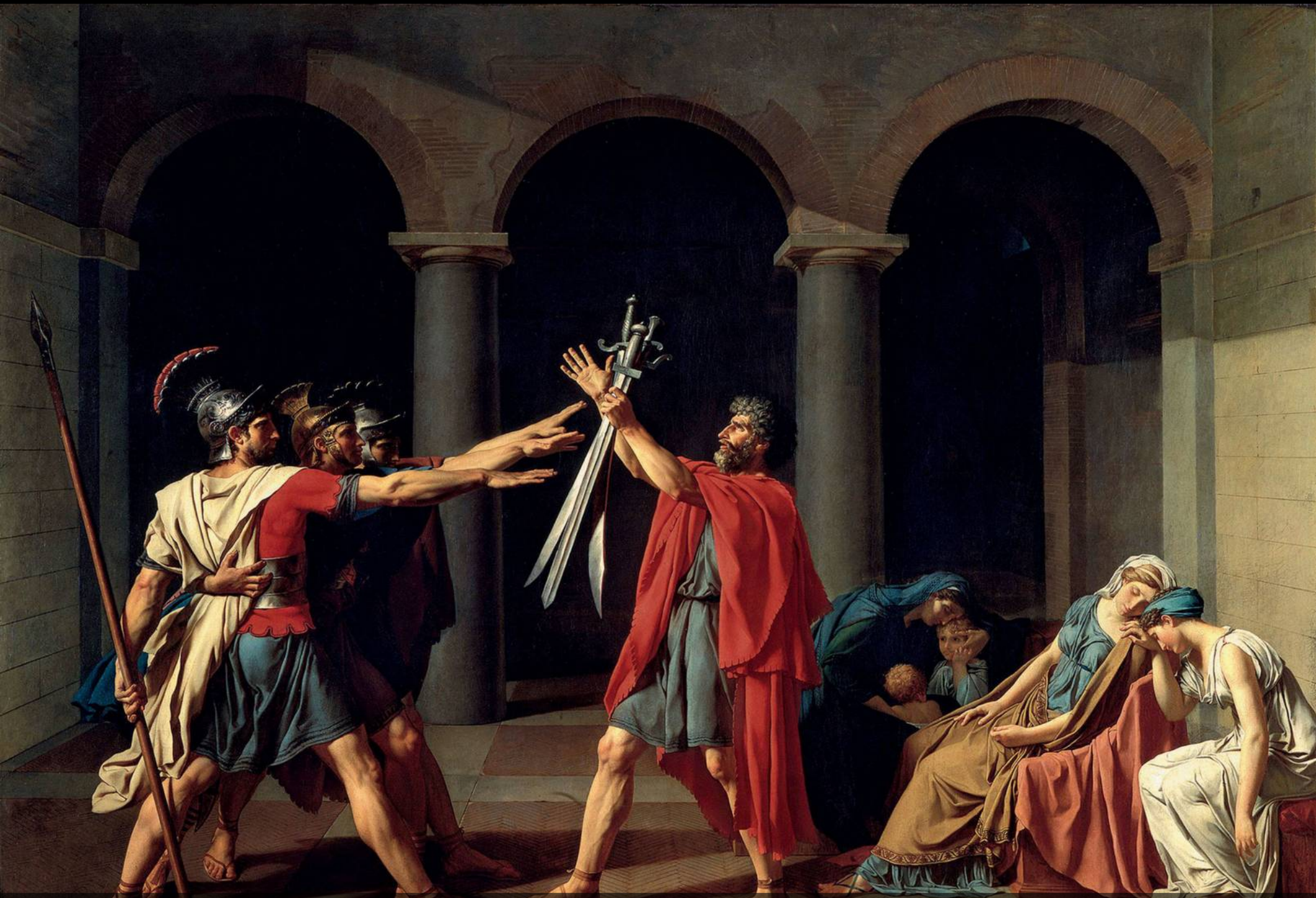
Jacques-Louis David – Le Serment des Horaces - 1785