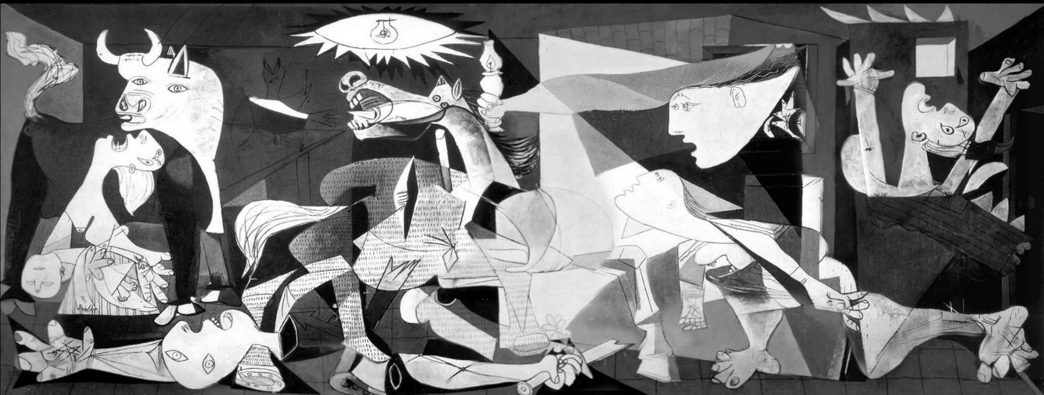
Pablo Picasso – Guernica - 1937