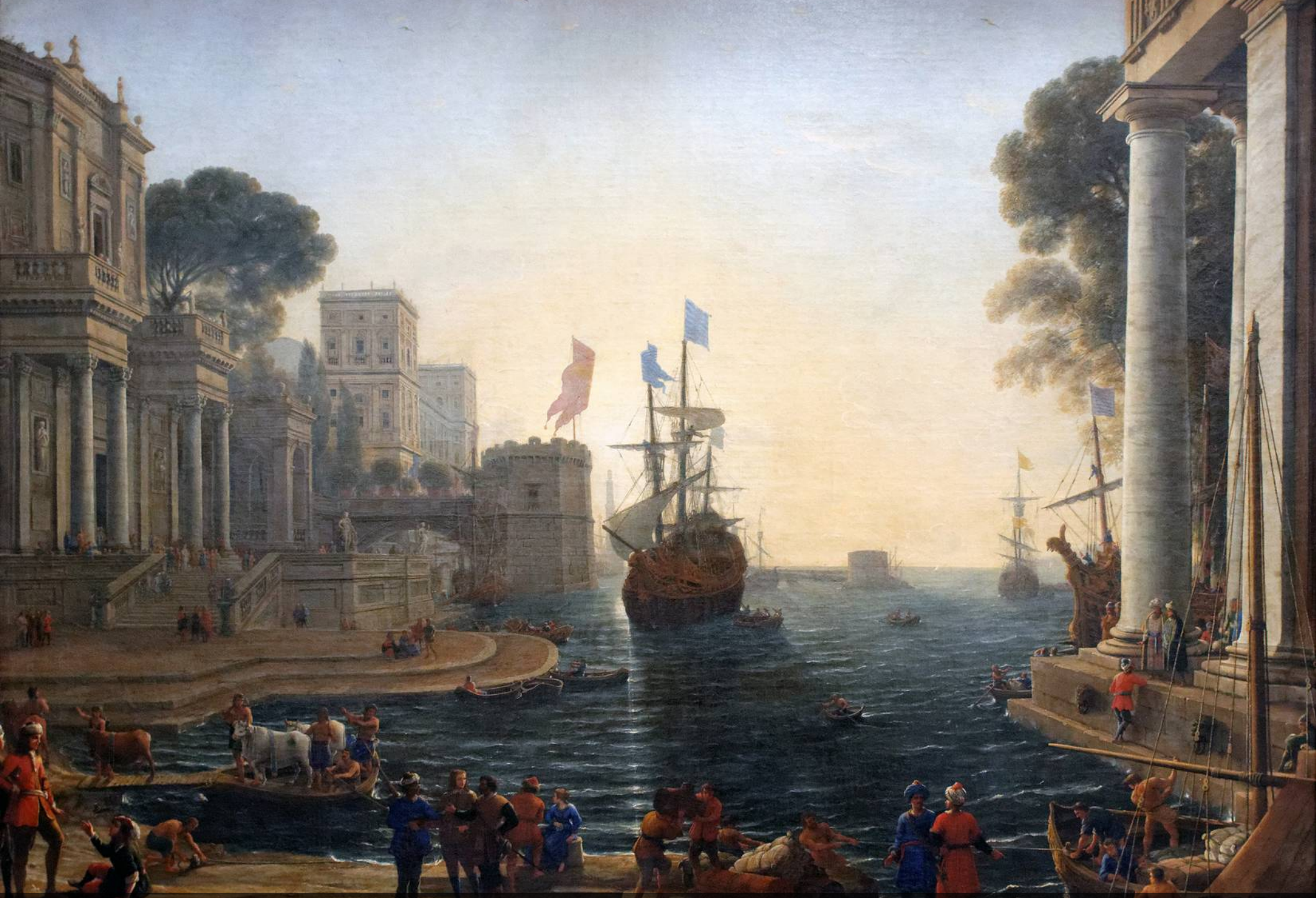
Le Lorrain- Ulysse remet Chrysis à son père - 1644