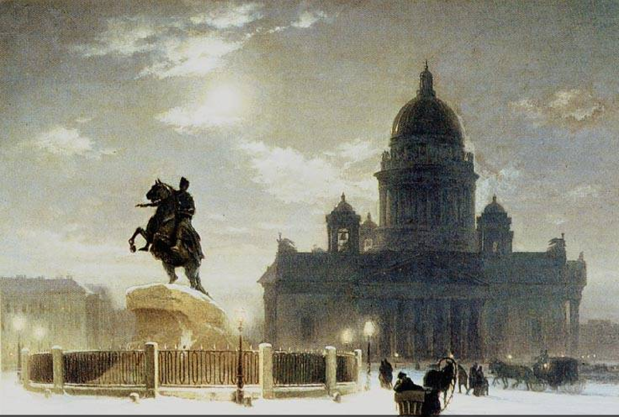
Alexandre Pouchkine – Le cavalier de bronze - 1833