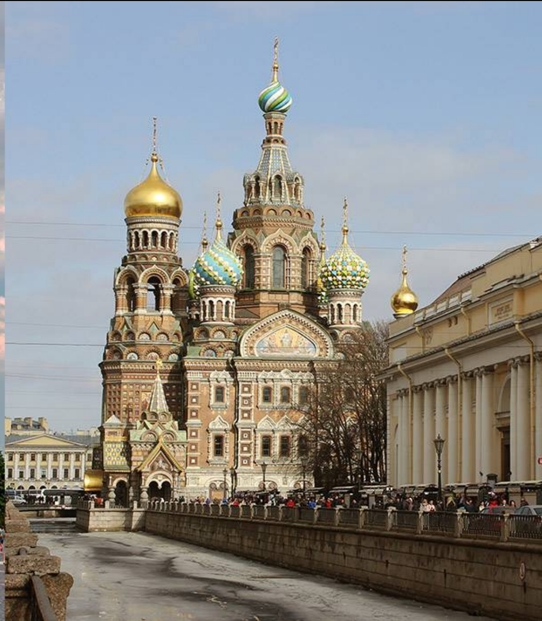
Cathédrale St-Sauveur sur le sang versé Saint-Petersbourg 1883-1907