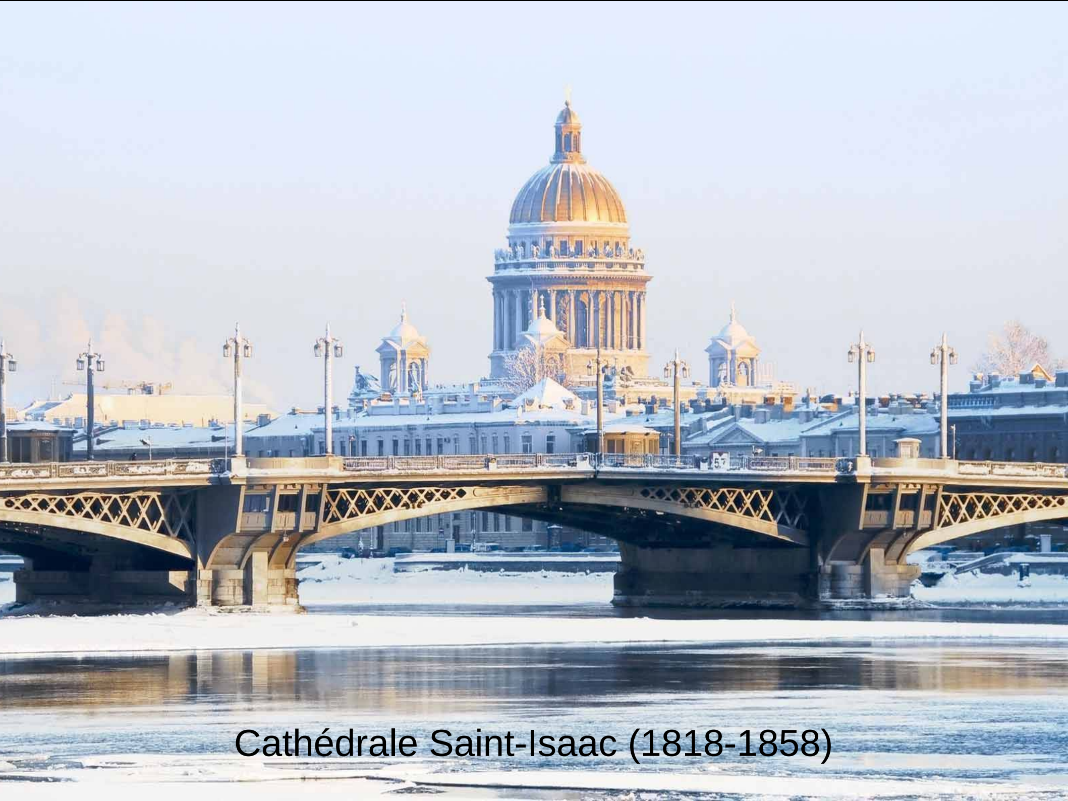
Cathédrale Saint-Isaac (1818-1858)