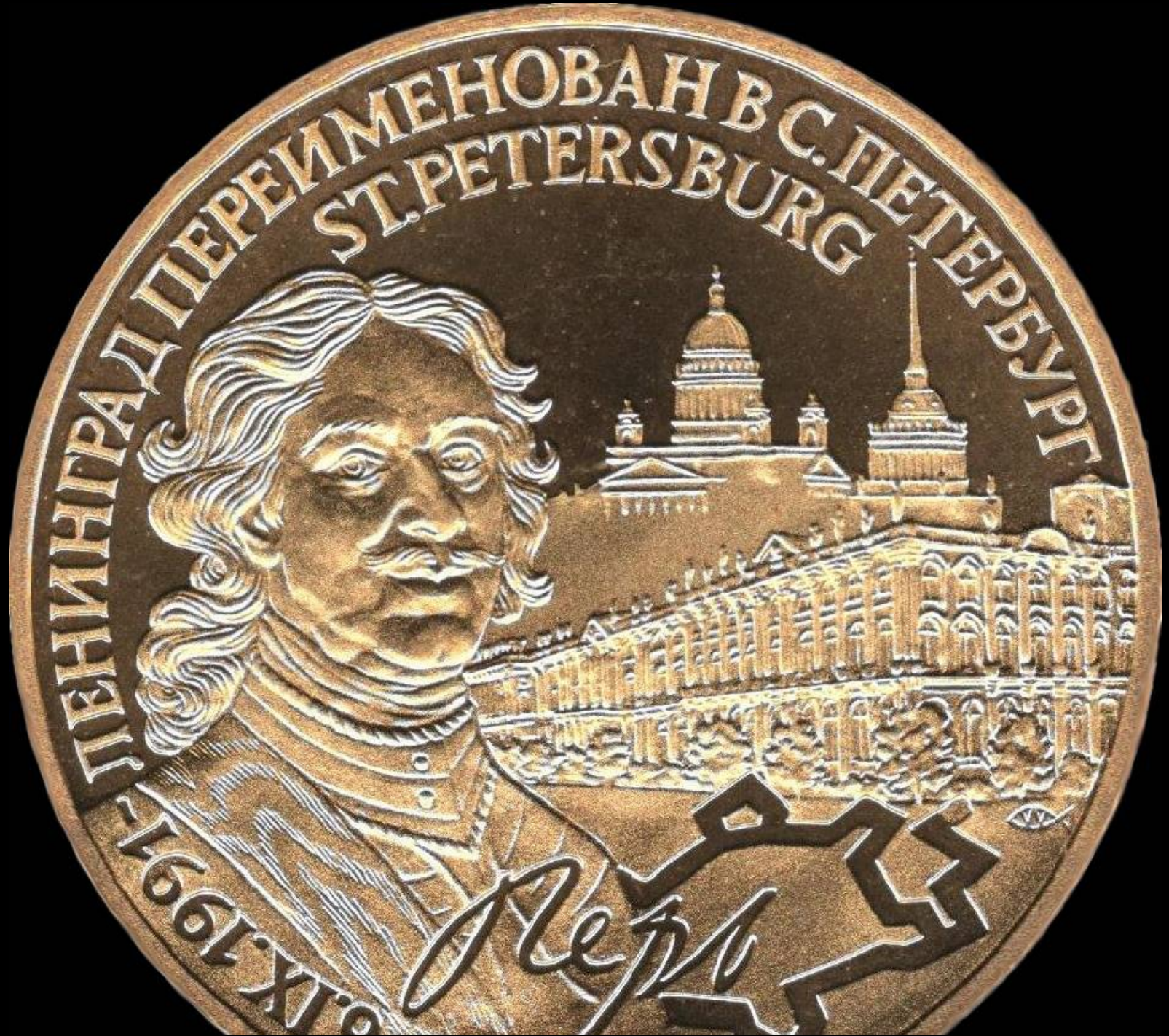
Octobre 1991 : Saint-Pétersbourg retrouve son nom initial