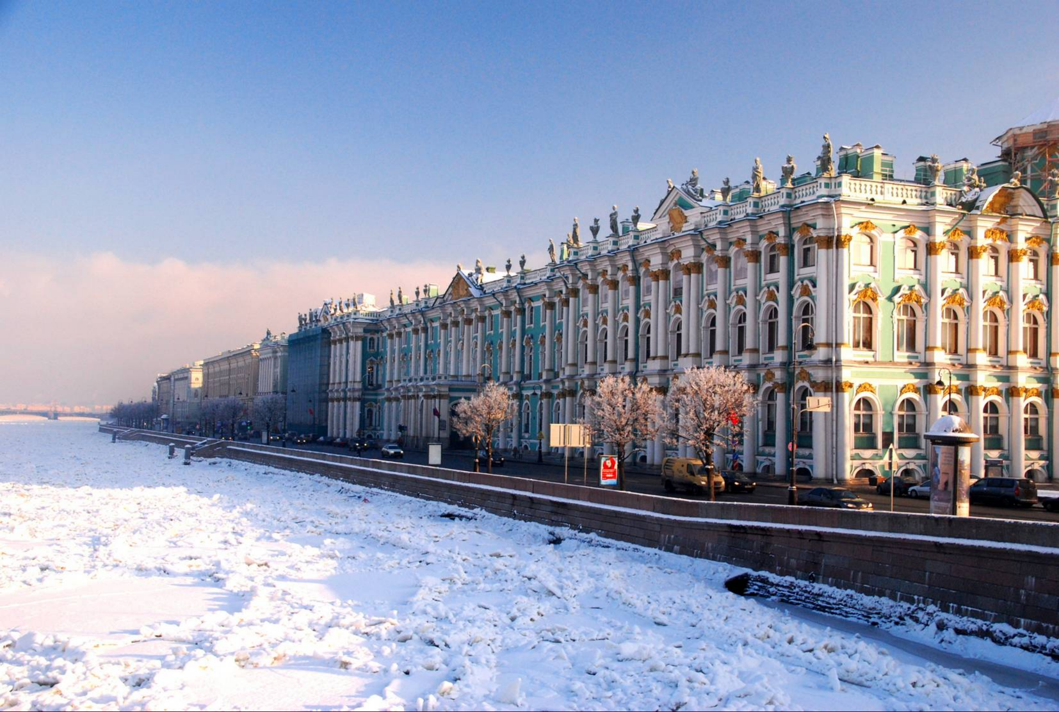
Palais d'Hiver, résidence des tsars de 1732 à 1917