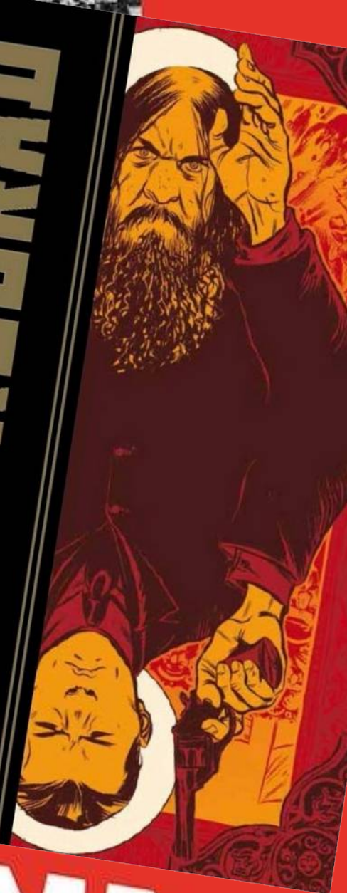
Petrograd (Петроград) - 1914-1924