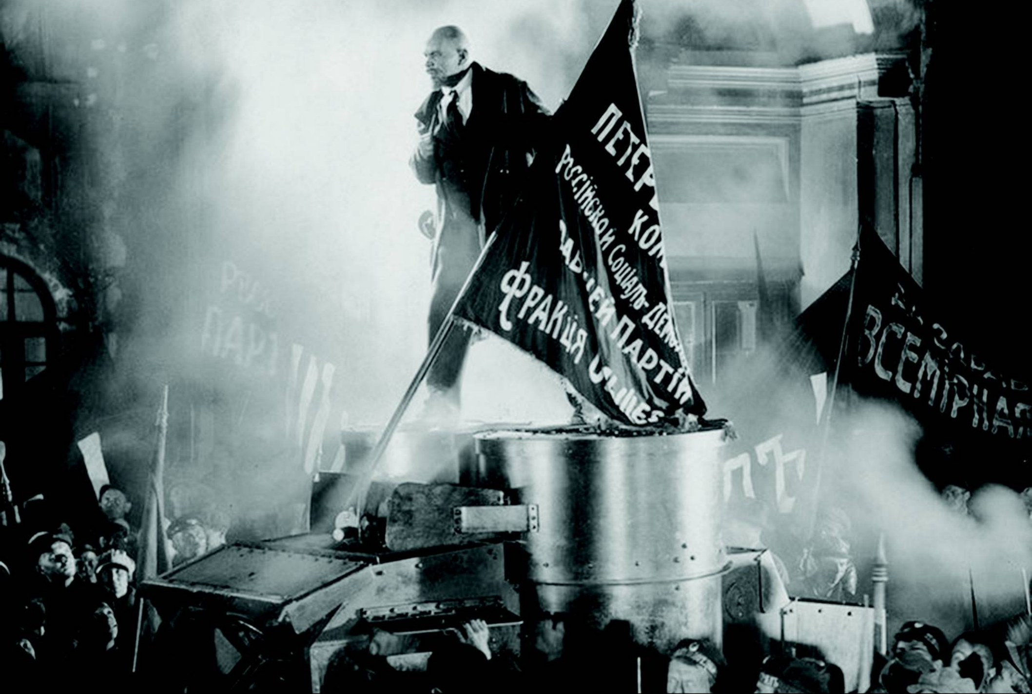
Octobre : dix jours qui ébranlèrent le monde – Eisenstein (1928)