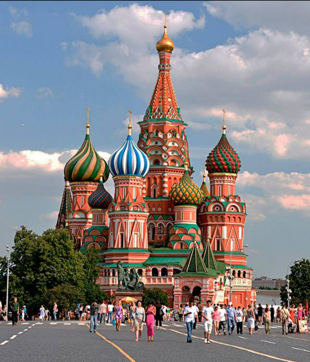
Cathédrale St-Basile le Bienheureux Place rouge – Moscou 1555-1561