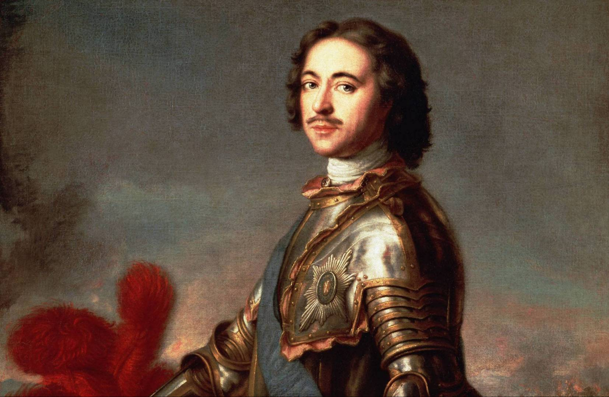
Pierre le Grand (Piotr Alekseïevitch Romanov) - 1672-1725